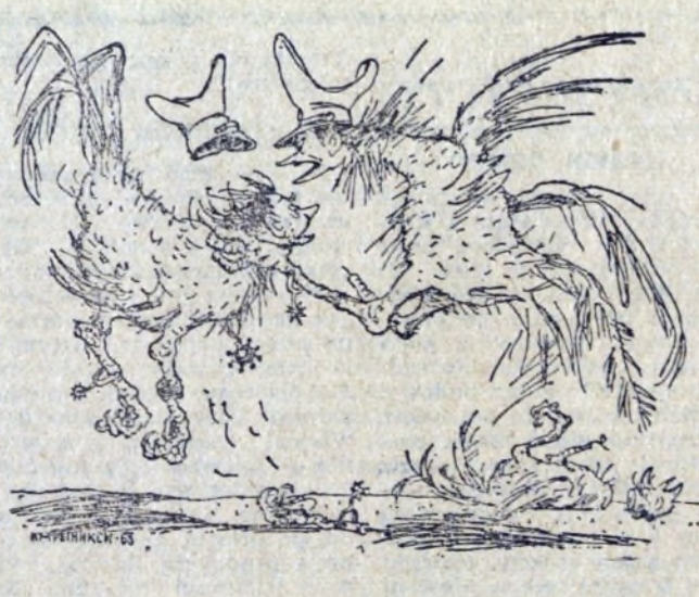
W sajońskim kurniku... („Prawda”)