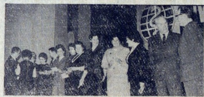
Grupa pracowników nowohuteckiej służby zdrowia odznaczona Odznaką Budowniczego Nowej Huty.

„GŁOS NOWEJ HUTY”. Adres redakcji: Huta im Lenina. Telefony: bezpośredni — 128-99, przez centralę HIL 101-00 101-20, wewn. 48-11 (red. odpowiedzialny), 55-61 (sekretarz red.). Druk: Drukarnia Prasowa w Krakowie, ul. Wielopole 1. L-7