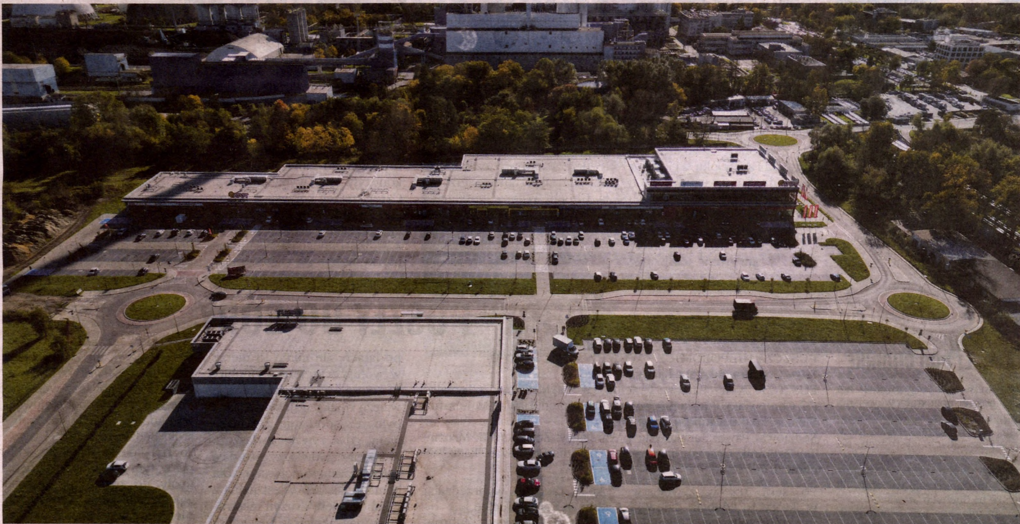
Zdj.: Nowe rondo łączące ul. Nowohucką z Galicyjską.