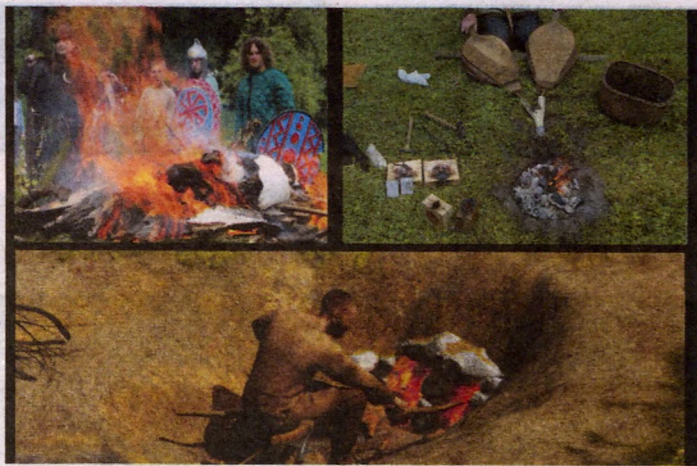
Fot. archiwum MAK, rekonstrukcja Łukasz Wójcik, grafika Małgorzata Byrska-Fudali.