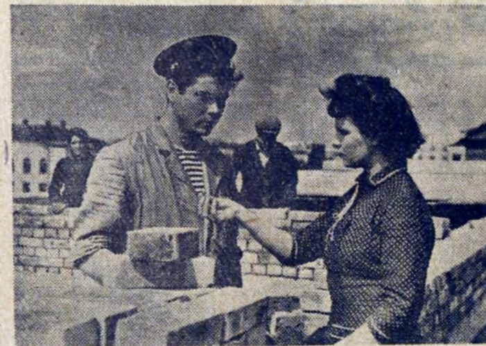
Scena z filmu pt. „Miłość należy cenić”.

nowym filmem polskim z tych czasów pt. „LUDZIE Z POCIĄGU”. Źródłem inspiracji scenariusza jest opowiadanie Mariana Brandysa „Maminsynek”. Bohaterowie filmu, to dosłownie ludzie z pociągu, a właściwie z dwóch wagonów, odceplonych na pastwę losu na malej stacyjce.