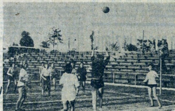
W turnieju siatkówki kobiet pierwsze miejsce zajęła drużyna Wydziału Mechaniczno-Konstrukcyjnego przed Wydziałem Kolejowym. Na zdjęciu fragment spotkania między zwyciężcą turnieju i drużyną Walcowni Zimnej Blach.

czwarty do finałów na szczeblu Huty kończąc. Już w czerwcu rozpoczęły się w wydziałach i zakładach Huty zajęcia treningowe, zawody kontrolne oraz eliminacje, których celem było przygotowanie uczestników do rozgrywek i wyłonienie reprezentacji poszczególnych jednostek Huty. W Spartakiadzie 1000-lecia, rozgrywanej w 10 dyscyplinach sportowych biorą udział reprezentacje 20 wydziałów i zakładów, liczące ponad 2 tys. pracowników kombinatu.