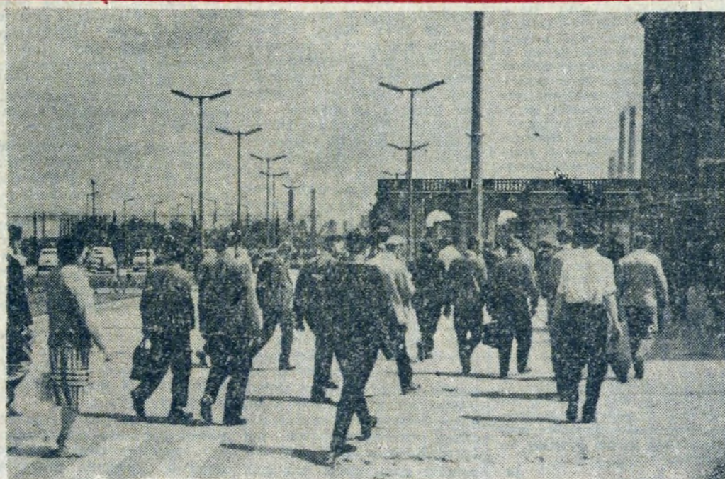
NOWA ZMIANA PRZEKRACZA BRAMY KOMBINATU.