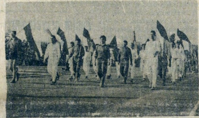
Fragm. defilady uczestników Spartakiady 1000-lecia. Maszerują sportowcy Zakładu Kokschemicznego.