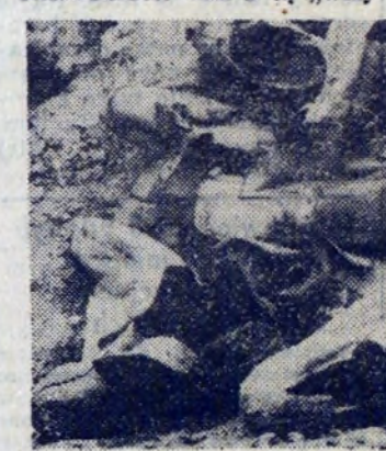
Stare zniszczone buty ciśnięto po prostu przy drodze. Taki element „dekoracyjny” wystawia hucie nienajlepsze świadectwo.

Czy jesteśmy pod względem porządków dobrze przygotowani aż na tyle doniosłych okoliczności? Jak z tą „wizytówką” gospodarności hutników? Ano, przekonajmy się o tym ruszając najlepiej w teren z ołówkiem i kamerą fotograficzną w rękę.