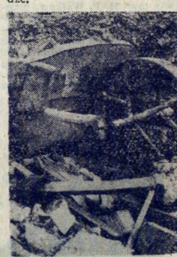
Gruz, złom żelazny, drzewo i... polamane taczki — oto co zastajemy na śmietniku obok Walcowni Drobnej.