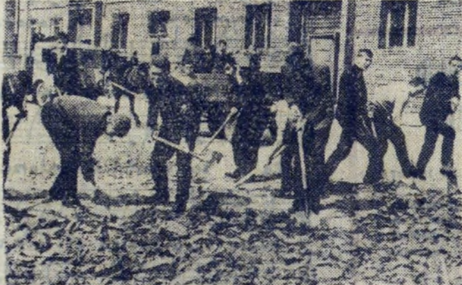
Młodzież szkolna przy porządkowaniu otoczenia swego budynku. Przykład uczniów ZSZ Budowlanej w N. Hucie wart jest naśladowania.

W pracy Zarządu dużą pomoc wykaże młodzież szkół nowohuckich, która w czynie