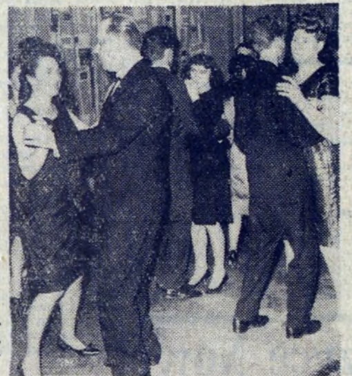
Tańczono dużo i z zapalem. Oto walc angielski.