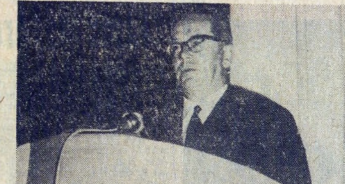
Przemawia uczestniczący w XVII Zjeździe SITPH wicepremier Eugeniusz Szyr.

Organizacja Zjazdu uznana została przez wszystkich jego uczestników jako bardzo sprawna. I dlatego chciałbym wyrazić członkom komitetu organizacyjnego, przedstawicielom SITPH i administracji huty — serdeczne podziękowania za wnieśioną pracę i za pełną poświęcenia działalność nad przygotowaniem obrad XVII Zjazdu SITPH w Hucie im. Lenina.