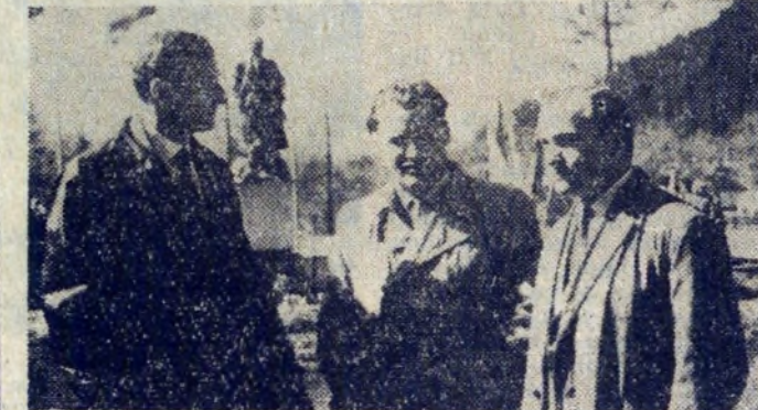
Członkowie delegacji z naszej huty w Poroninie.

Przy okazji wielu pracowników kombinatu oraz członków ich rodzin po raz pierwszy ujrzało Tatry w najwspanialszej ich krasie oraz świeżo zakwitłe na halach krokusy. Wielu zwiedziło Zakopane, a niektórzy zdążyli się nawet pięknie opalić na stoku Gubałówki, (dz)