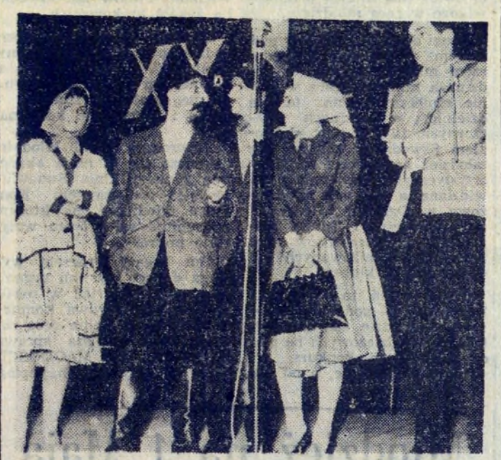
W Hali Garaży odbyła się impreza artystyczna pt.: „Wesoły Mandacik” w wykonaniu zespołu estradowego Komendy Głównej MO. Impreza ta została zainaugurowana obchodami związane z XX-leciem powstania MO i służby bezpieczeństwa. Na zdjęciu fragment wesołego skeczu „Chłopi zwiedzają Warszawę”. Tekst i fot. J. BROZEK

nym. W czasie zimy zostały zniszczone, zdewastowane, reszty „dzieła” dokonują starsze dzieci, nie dość pilnowane przez rodziców. Mamy jednak nadzieję, że akcja porządkowania dzielnicy, do której przystąpiono z takim zapałem — przyniesie spodziewane efekty i nie będziemy się już potykać o wyrwy w chodnikach... O. Hutnicki