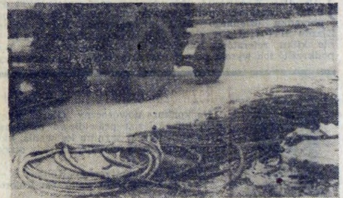
Czyżby ten kabel nadawał się już tylko na złom? Dlaczego ZRI dopuściło do takiego marnotrawstwa?

Kto jest gospodarzem tego wielkiego śmietnika? Kto odpowiada za marnotrawstwo? Nie wiem, nie udało mi się tego wyświecić, a szkoda gdyż adresata należałoby wymienić po nazwisku.