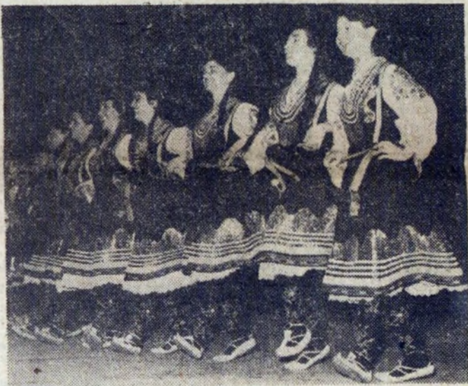
A oto młode Bułgarki w jednym z tańców ludowych.