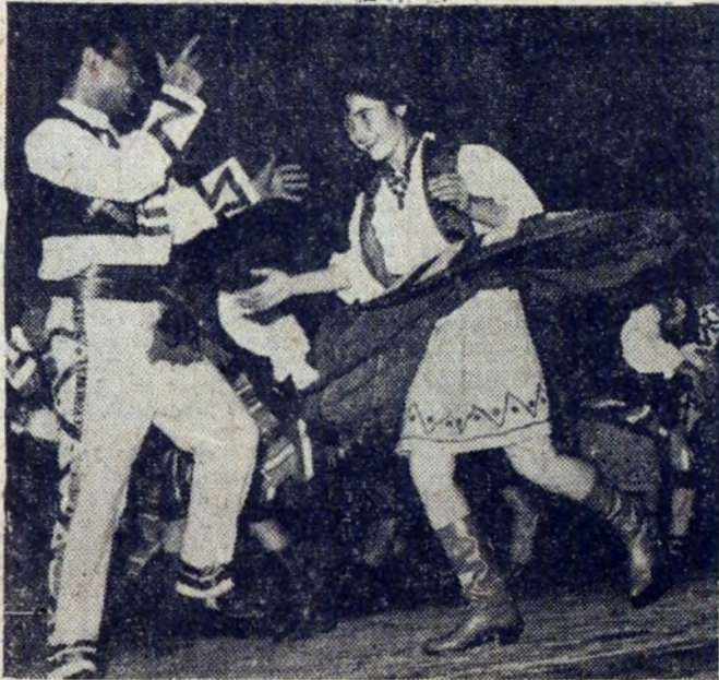
Z tego tańca przebiegał ogromny temperament. Zespół bułgarski nagrodzony został tutaj brawami.