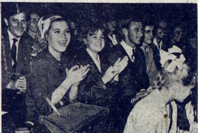
Publiczność bawiła się na obu występach doskonale.