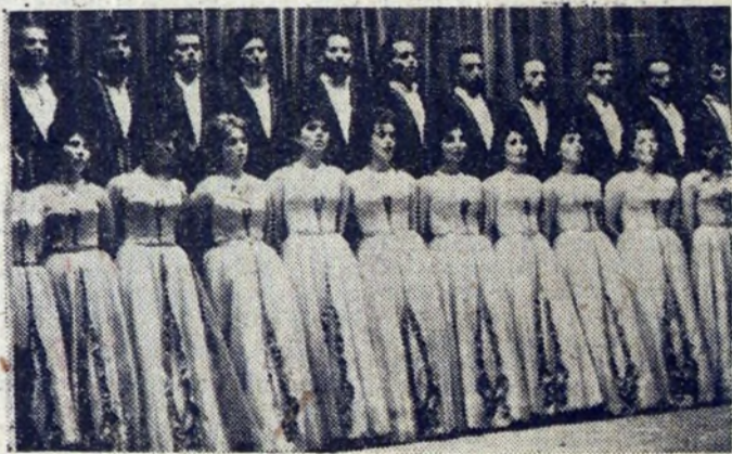
Inny charakter, ale również wysoki poziom zaprezentował zespół armeński. Na zdjęciu: chór śpiewa piosenkę robiącą karierę na całym świecie „Sza dziewczeczka”.