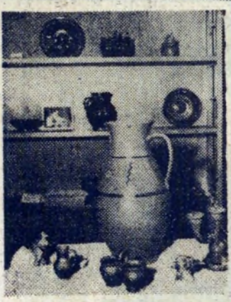
Swiecznik, dzban, dwójak, kogutek — wyszły właśnie spod rąk mistrza i eksponowane są na wystawie.