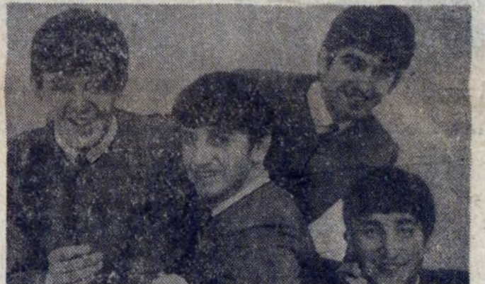
Beatlesi, to wcale sympatyczni chłopcy...

Nowy film świetnej aktorki francuskiej Michele Morgan nosi nazwę „Centurioni”, a realizuje go w Hiszpanii Mark Robson. Grają poza tym: