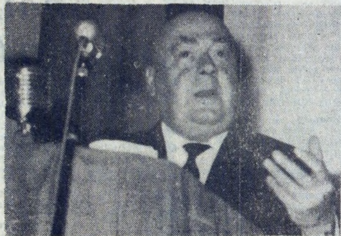
Przemawia tow. Józef Cyrankiewicz.