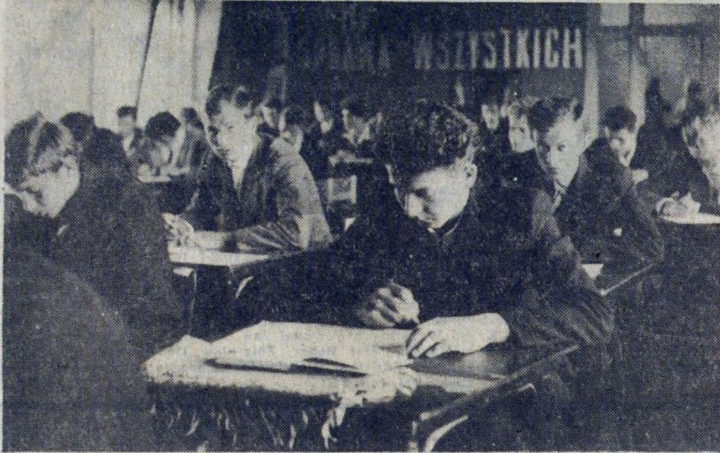
PRZYSZŁOŚCIA MŁODZIEŻY NOWOHUCKIEJ JEST PRZED WSZYSTKIM HUTA IM. LENINA, KTÓREJ ZAŁOGA WZROŚNIE PRAWIE DO 30 TYS. W ROKU 1970.

Zanim oddasz głos • Zanim oddasz głos • Zanim oddasz głos •