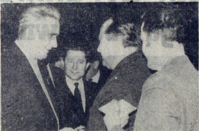
A oto moment dekoracji zasłużonych budowniczych HiL.