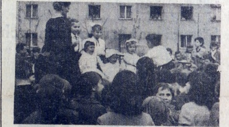
Występy maluchów z osiedla zgromadziły wielu widzów, szczególnie dzieci.

W ub. niedzielę najmłodsi mieszkańcy os. Centrum A otrzymali piękny ogródek jordanowski. Obiekt ten jest dziełem aktywu społeczeństwa politycznego osiedla, mieszkańców, głównie młodzieży oraz zakładu opiekuńczego — pracowników Koksochemii. Wartość placu zabaw, wykonanego w ramach czynów społecznych wyniesi około 250 tys. zł. Pracownicy Zakładu Koksochemicznego wykonali ogrodzenie i szereg urządzeń zabawowych jak huśtawki, zjeżdżalnie itp. W planie jest