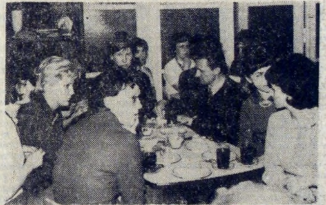
W klubie „Ewa” w środowe wieczory pełno. Miło jest odpocząć w kameralnej, koleżeńkiej atmosferze... Spotkania połączone są zawsze z ciekawymi prelekcjami, dyskusją i występami zespołów muzycznych z HiL.