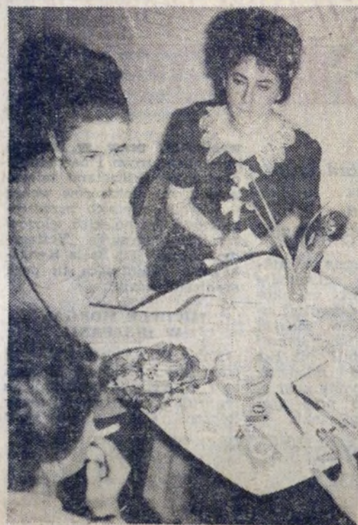
Niedawno w kawiarni ZDK HiL odbył się koncert fortepianowy dyplomantek WSM klasy prof. J. Hoffmana. Była to pewnego rodzaju propozycja stałego organizowania wieczorów muzycznych dla bywalców klubokawiarni ZDK i słuchaczy Wieczorowego Studium Kultury. Wysoka frekwencja świadczyła o dużym zainteresowaniu imprezą.

W ramach prac społecznych wykonano już świetlicę w Łęgu, w trakcie budowy jest podobna placówka w Wadowie. (bs)