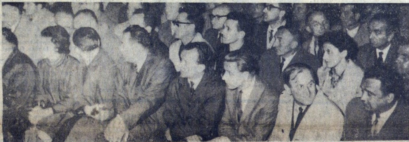
Na spotkanie przybyli licznie wyborcy z kombinatu i dzielicy.