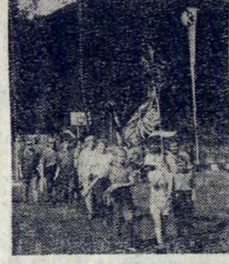
Na trasie Złota TK

NAJSZYBCEJ KRĘCA — W WALCOWNI GORĄCEJ Zawody kolarskie, które odbyły się na bieżni stadionu Hutnika przyniosły zespołowy sukces drużynie Walcowni Gorącej z wynikiem 8,94,0 min (jest to suma czasów uzyskanych przez pierwszego i czwartego zawodnika drużyny.) Drugie miejsce zajęł Wydział Mechaniczno-Konstrucyjny — 8,08,2 min, 3. Walcownia Zimna — 8,08,4 min, 4. Zakład Koksochemiczny — 8,13,6 min, 6. HPR — 8,17,0 min.