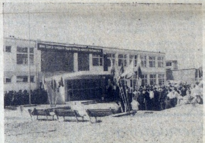
Oto duma budowniczych HiL — nowa szkoła na os. Na Lotnisku