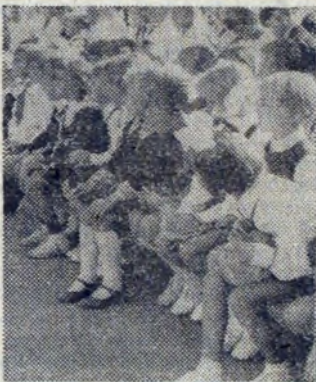
Grupa dzieci ze szkoły podstawowej nr 102 przy ul. Bułwarowej