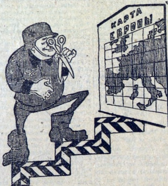
Mrzonki „krojczego” z Bonn...

Bońscy odwetowcy występują z bezczelnymi żądaniami rewizji europejskich granic, powstałych w wyniku II wojny światowej i klęski niemieckiego faszystwu.