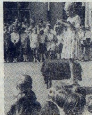
Młodzież w skupieniu wysłuchała listu ministra oświaty. List odczytuje jedna z wychowawczyń