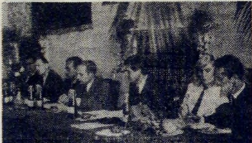
Prezydium konferencji sprawozdawczo-wyborczej ZMS w TA.

NALEŻNOŚĆ ZA ZAKUPY DOKONANE W PDT MOŻNA REGULOWAĆ OPDISEM Z KSIĄŻECZKI OSZCZĘDNOŚCIOWEJ PKO.