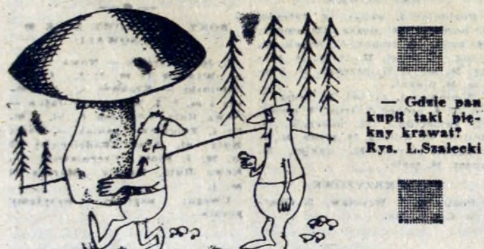
— Gdzie pan kupił taki piękny krawiec? Rys. L. Szalecki

Nowością bieżącego sezonu jest również zakup sprzętu obozowego, harcerskiego, dla 3 szkół podstawowych. Dotyczy to takiego sprzętu, jak namioty, łózka, materace, garnki itp. co w dużym stopniu ułatwi organizację akcji wczasowych. Wydział Oświaty zaopatrzył się również w komplet sprzętu kolonijnego, na 120 dzieci. Wyposażenie to pozwoli na wzajemną wymianę dzieci z inną kolonią letnią.