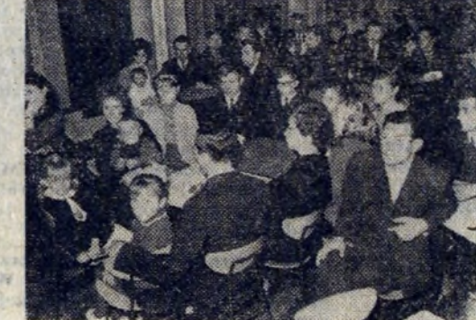
Przedstawiciele załogi W-713 na uroczystości w Ognisku Młodych.