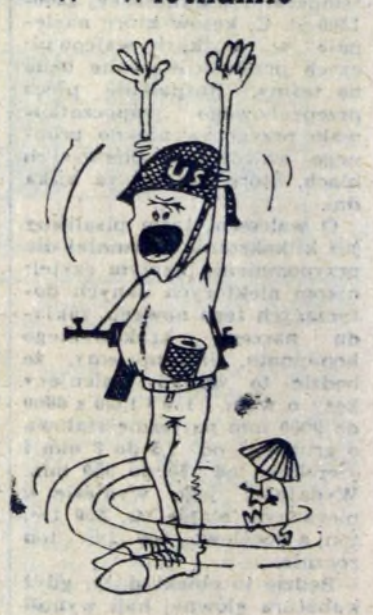
Kaluaku, jestem otoczony! Rys. L. SZALECKI