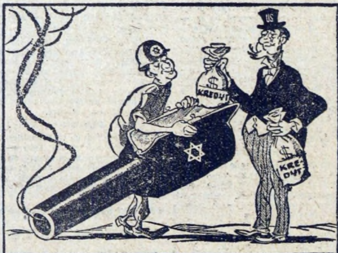
Worek bez dna...

Senat amerykański postanowił przyznać długoterminowe kredyty dla Izraela, który dzięki temu może zakupić w USA broń wartości 430 mln dolarów.