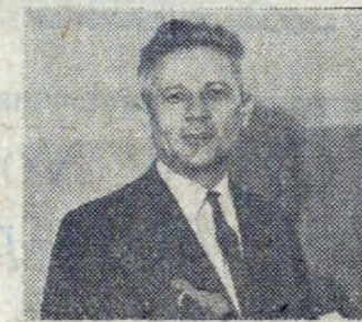
Dyr. Stepień również spleśnie na lekcję...