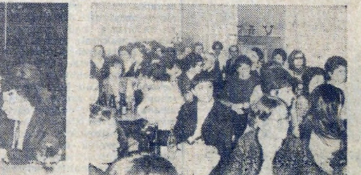
A oto przedstawiciele załogi — jubilatki.