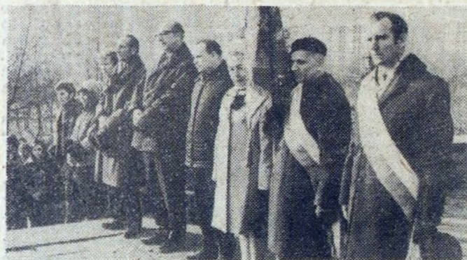
Poczet szfandarowy ZO ZBoWiD w Nowej Hucie.