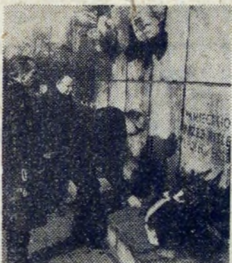
Hołd oddają poległym zbrojowcom z Nowej Huty.