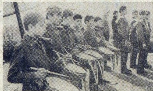
Przy dźwiękach harcerekich werbli.