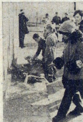
Składanie wianców i kwiatów przez młodzież.