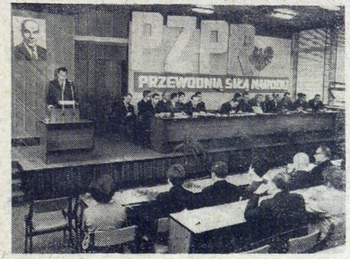
Fragment sali obrad podczas dzielnicowej konferencji sprawozdawczo-wyborczej.

Referat wprowadzający do dyskusji, oceniający działalność w ubiegłej kadencji oraz zawierający propozycje przyszłej działalności, wygłosił I