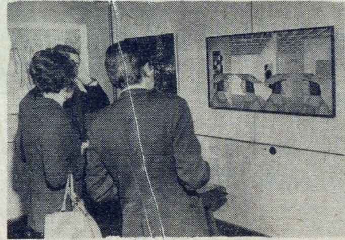
Na wystawie w Salonie TPSP.

znaczkę, medale i dyplomy. A potem — ciekawym rozmowom i wymianom myśli nie było końca. Wszyscy na swój sposob