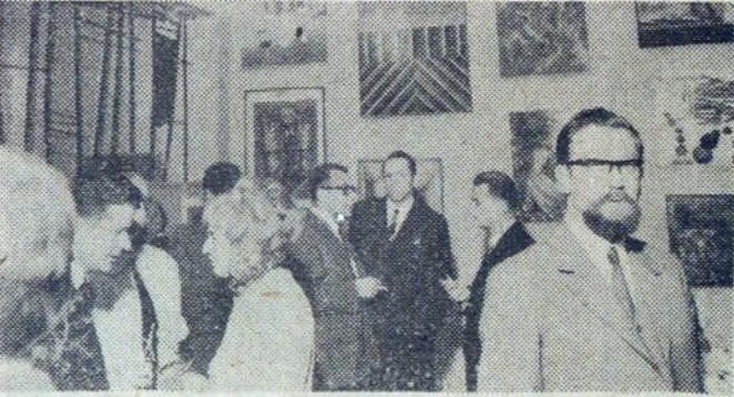
Zywo dyskutowano nad twórczością nowohuckich plastyków.