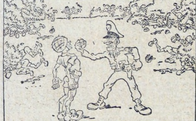
— Ile razy mam cię uczyć, abys nie podchodził za blisko krzaków? („Prawda“)

Liczba dezertów z armii południowietnamskiej rośnie w zaskakującym tempie.