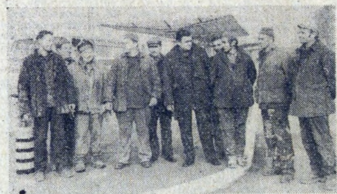
Oto ci, którzy pracowali przy budowie dworca autobusowego.