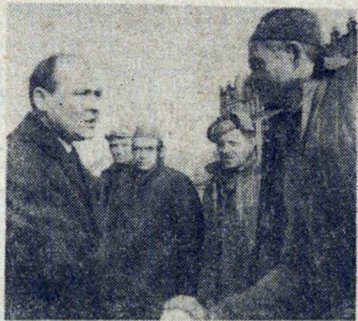
Fot. St. GAWLIŃSKI

Gratulacje robotnikom za dobrą pracę przekazuje dyrektor Kania.