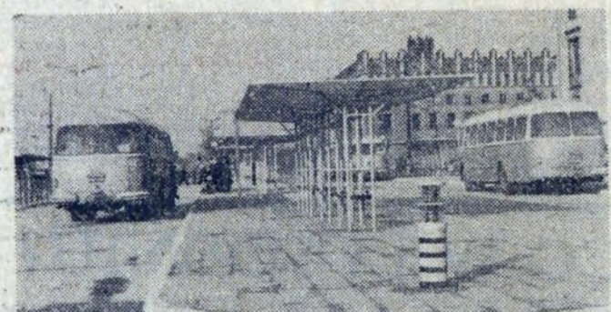
Nieźle prezentuje się nowy dworzec. Jest tu dość miejsca dla autobusów, co znacznie usprawniło ich ruch.

NA DWA TYGODNIE przed terminem, 15 listopada br. pracownicy Wydziału Transportu Samochodowego HIL wykonali swoje przedzjazdowe zobowiązanie oddając do użytku załogi dworzec autobusowy MPK przed budynkiem „S”. Realizacja tej inwestycji pozwoliła zaoszczędzić około 1 mln złotych w stosunku do kosztorysu projektowego. Przekazując nowoczesny za-