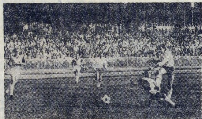
Oto jeszcze jeden fragment meczu Kadra — Hutnik.

O taki właśnie doping proszą sami piłkarze.