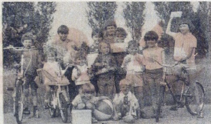
Oto zwycięzcy mini-spartakiady zorganizowanej przez TKKF HiL.

Wszystkie odjazdy autobusów oraz odbiór dzieci odbywają się przy Hali Sportowej KS „Hutnik”, ul. Igołomska. (ew)