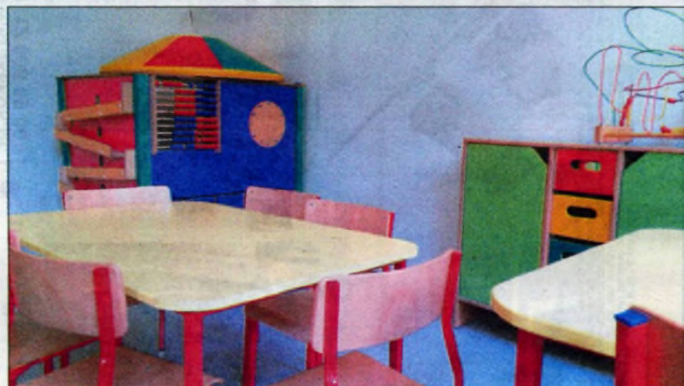
Zespół Szkół Specjalnych nr 6 – sala po remoncie.