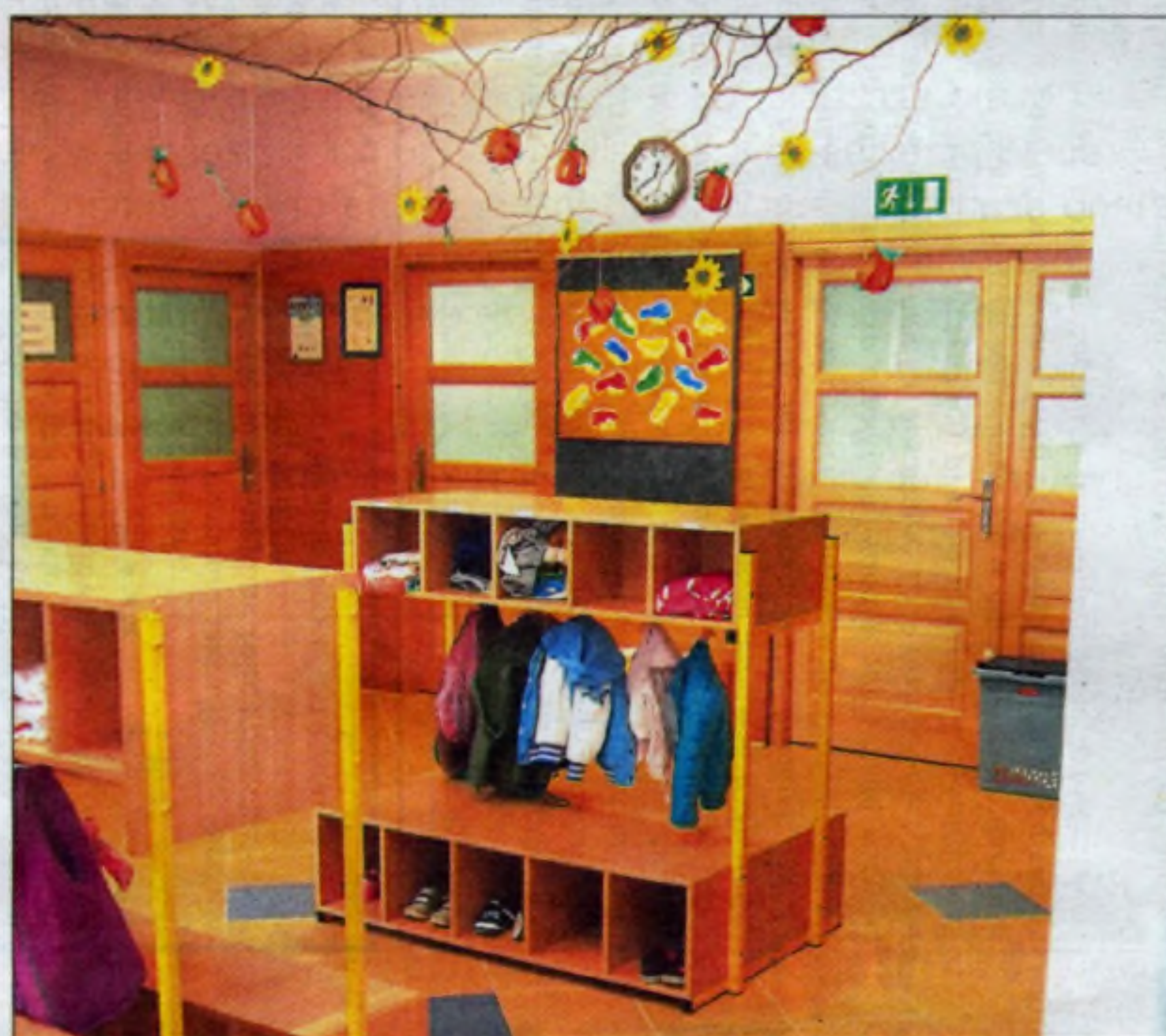
Przedszkole nr 99 – szatnie po remoncie.