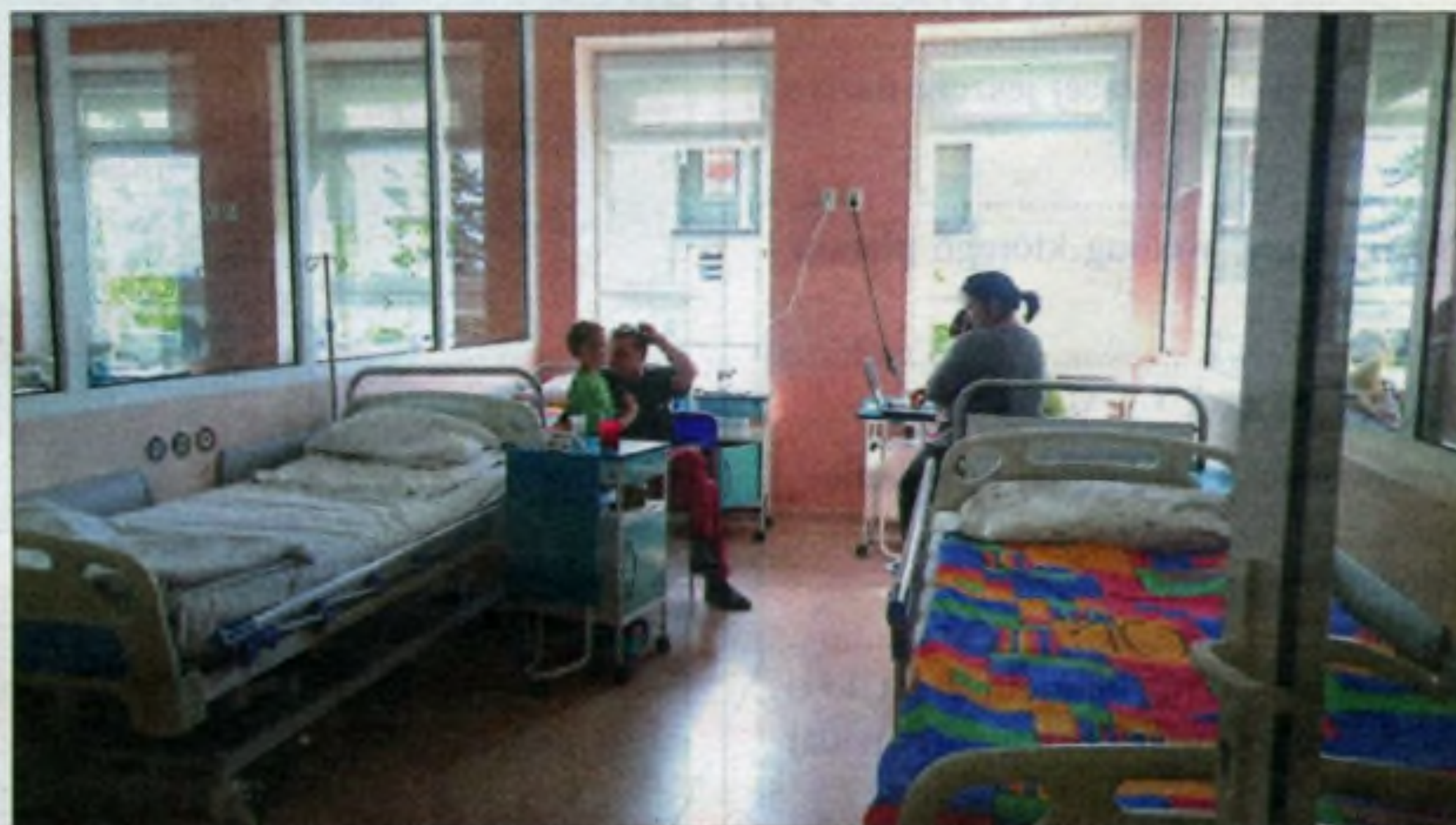
Sala starszych dzieci.