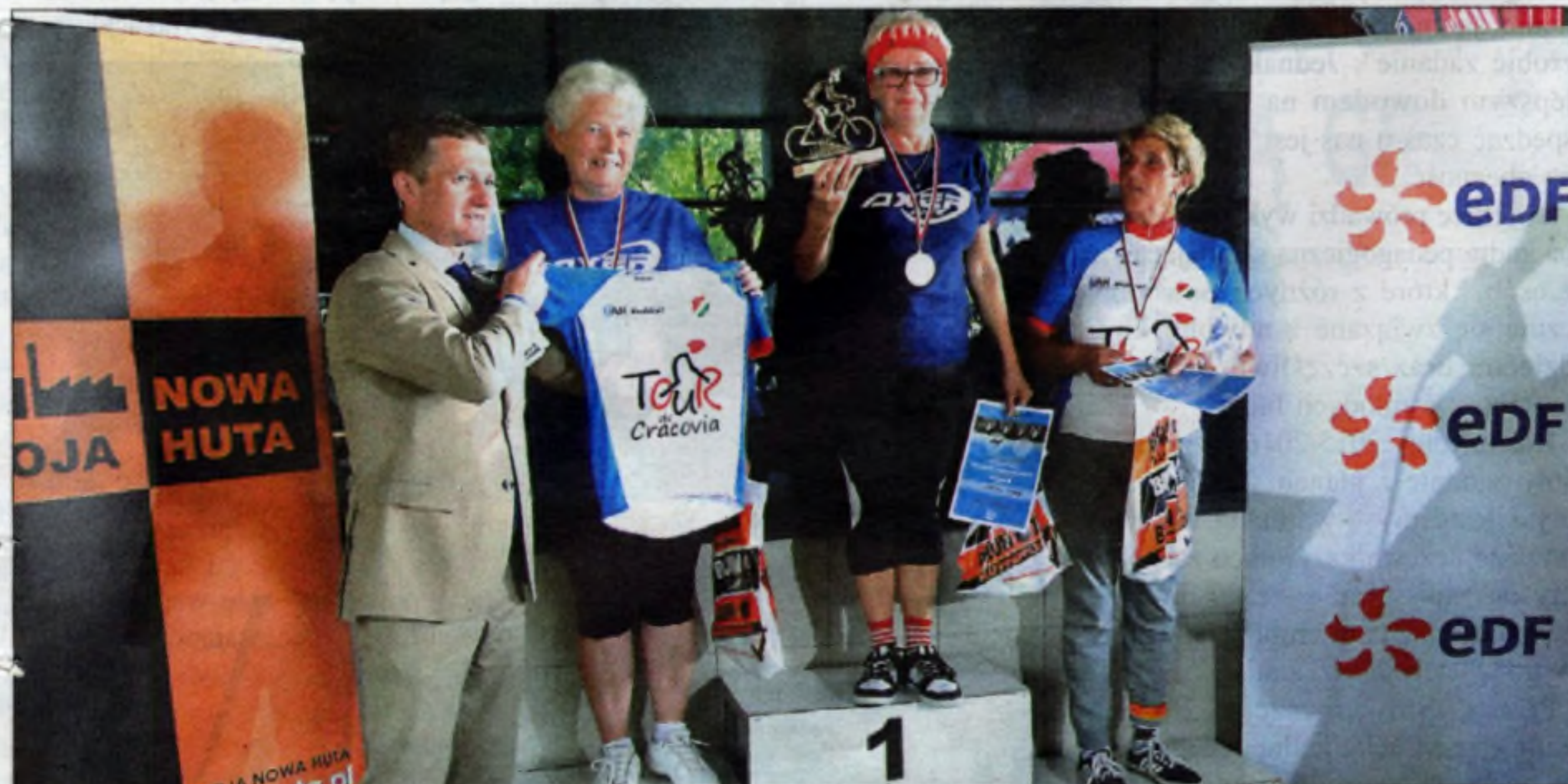
Zwieńczenie wysiłków – upragnione podium.