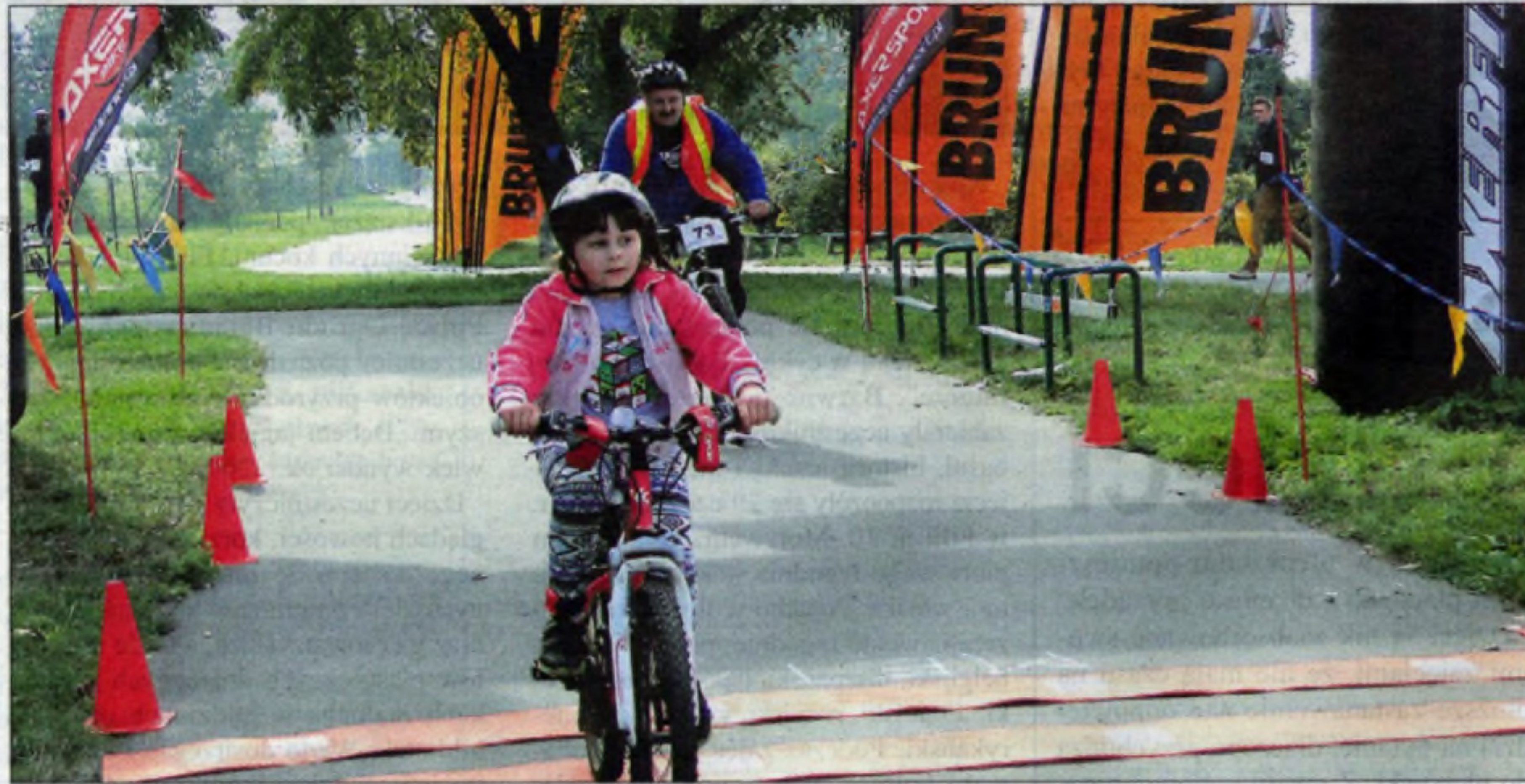
Uff, nareszcie meta.