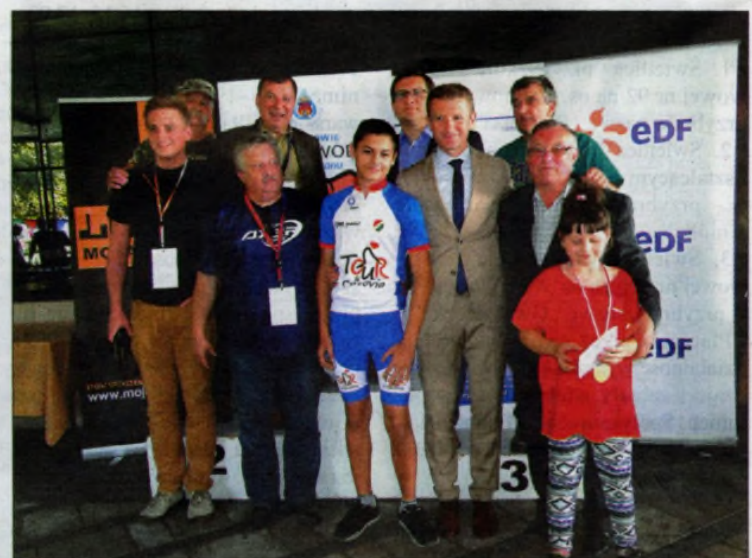
„Rodzinne” zdjęcie w gronie organizatorów.