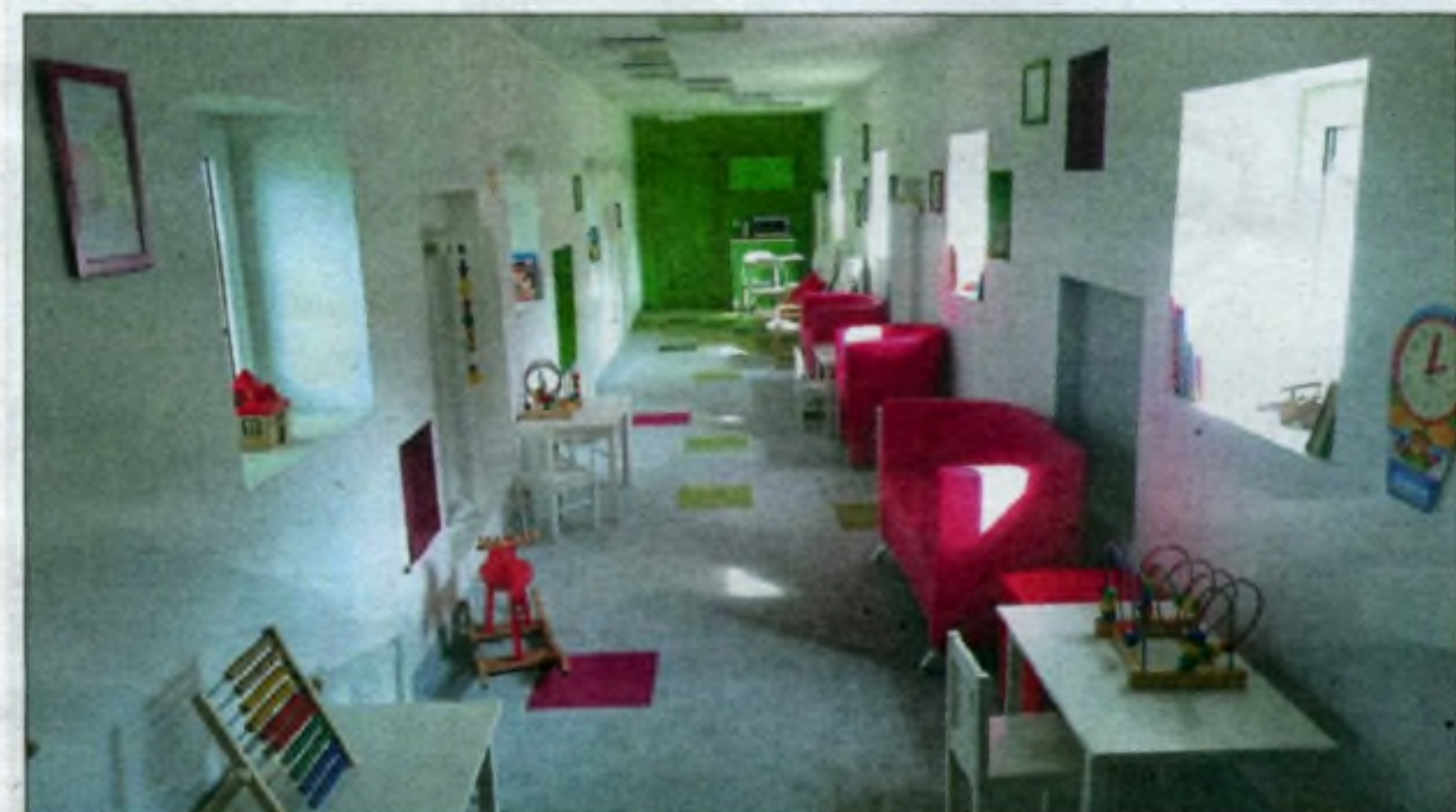
W strefie rodzica jest równie kolorowo jak na całym oddziale.