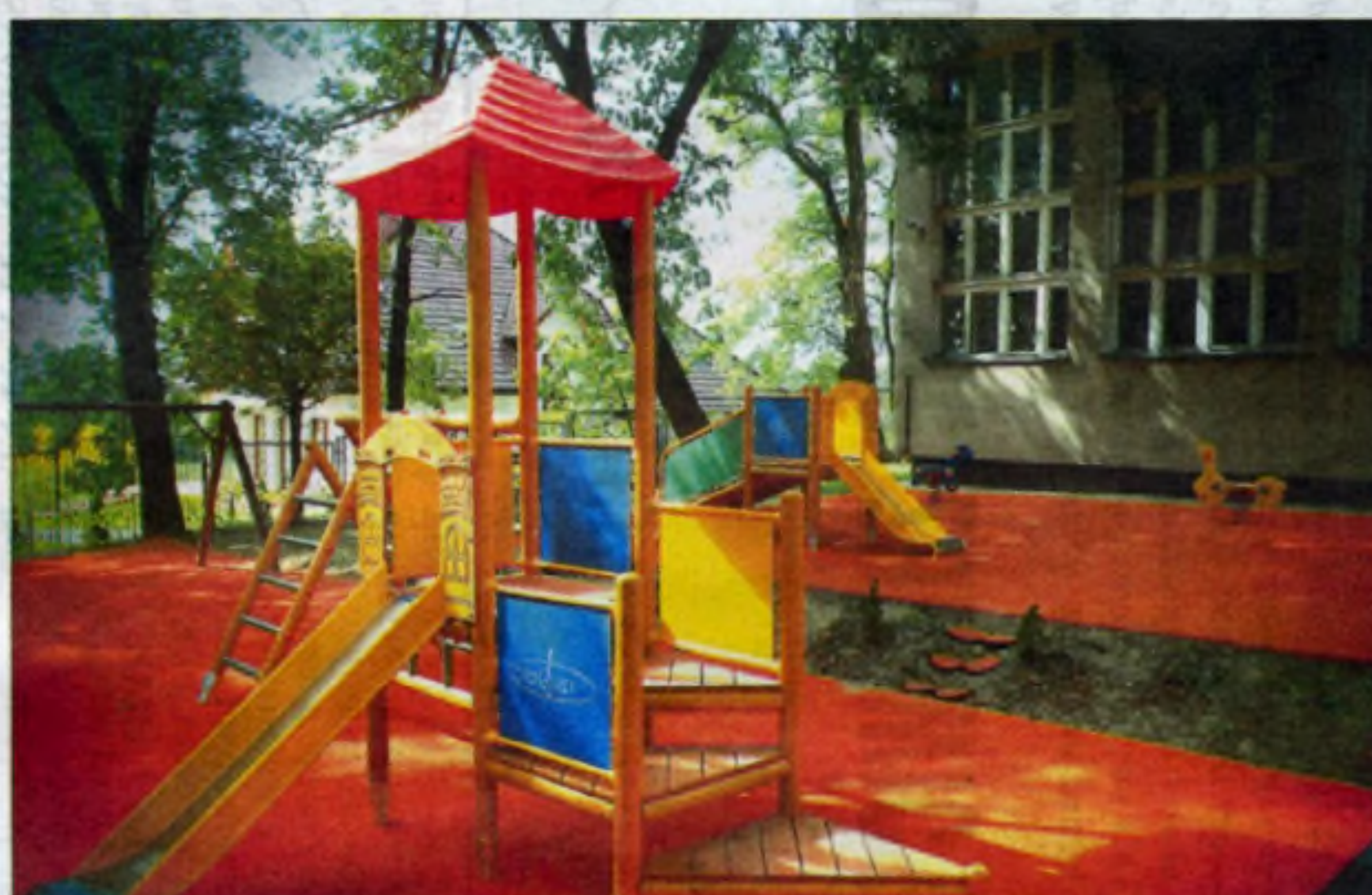
Nowy plac zabaw przy Zespole Szkolno-Przedszkolnym nr 9.