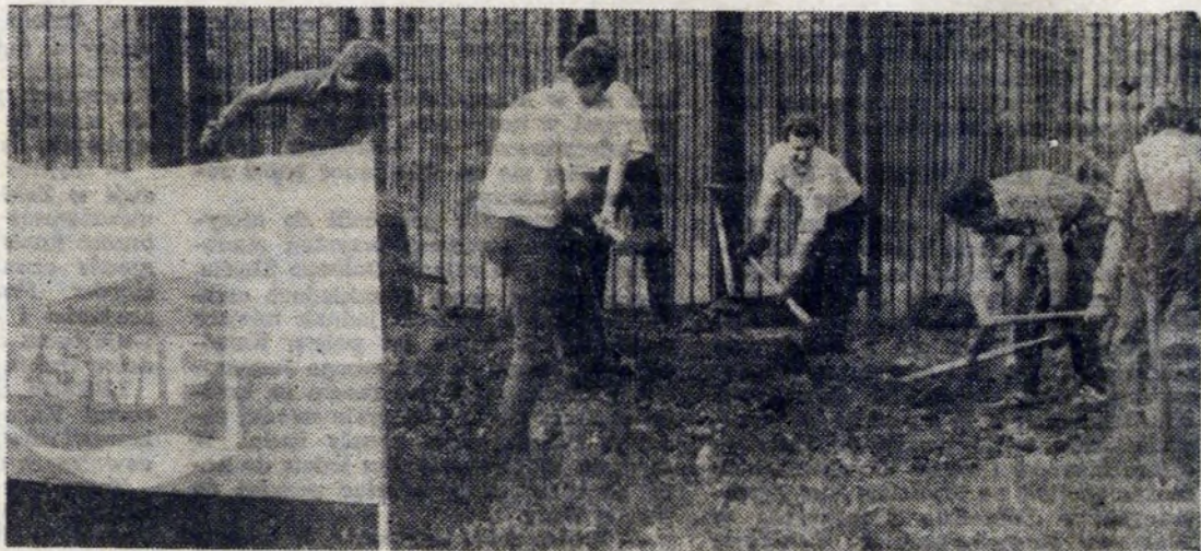
Swoje święto uczcili członkowie organizacji młodzieżowej pracą społeczną.

Ważnym momentem w historii organizacji młodzieżowej w kombinacie była II KONFERENCJA SPRAWOZDAWCZO-WYBORCZA w 1979 roku. W jej trakcie młodzi hutnicy, za swoją działalność, otrzymali od Zarządu Głównego ZSMP sztandar „Dla przodującej organizacji zakładowej”.