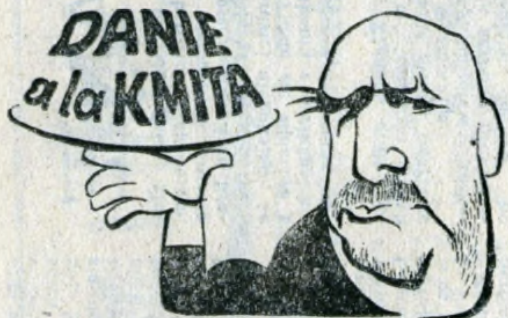
Zupa ziemniaczana z mięsem