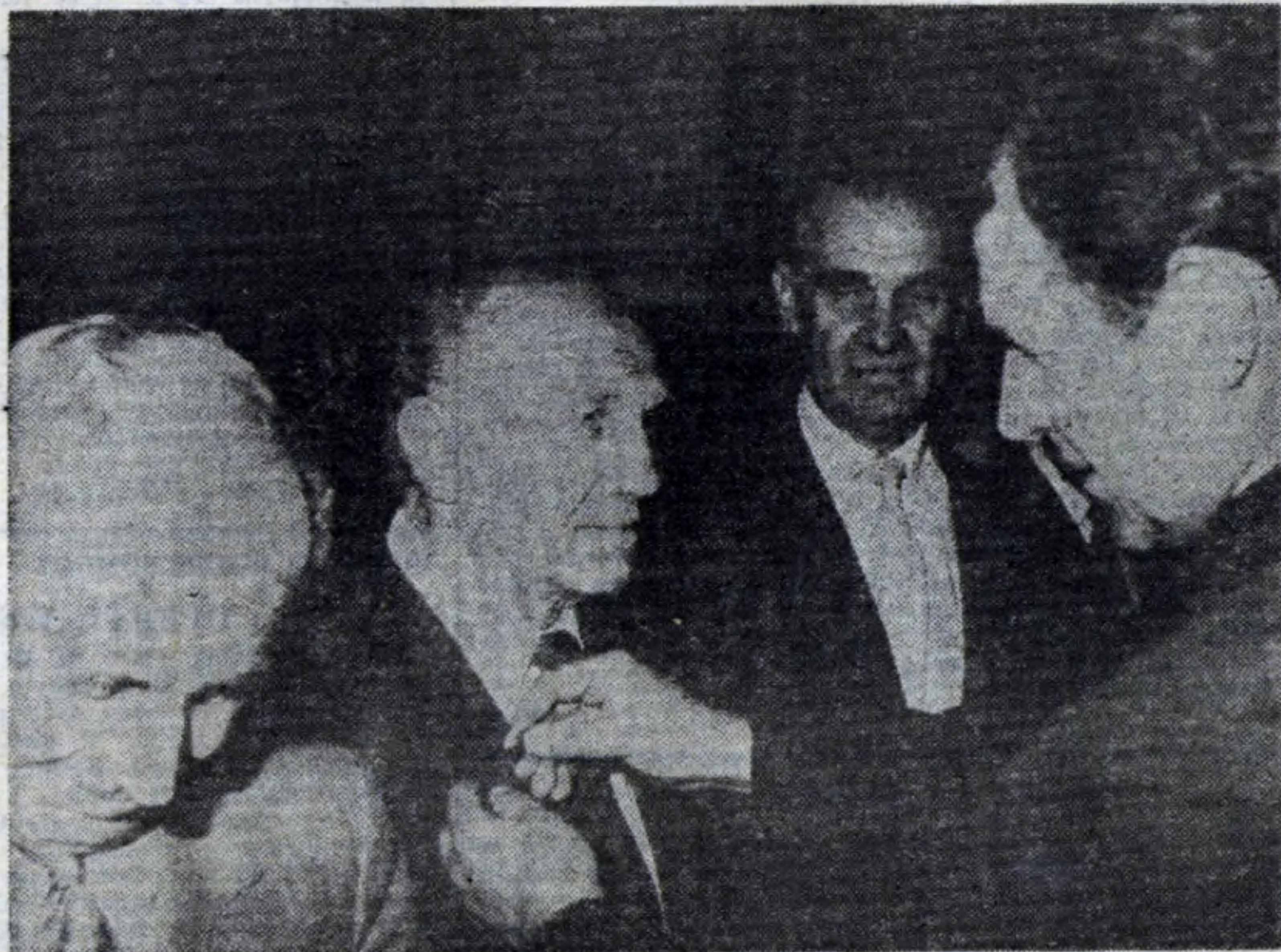
Po raz pierwszy hutnicy otrzymali odznaki „Zasłużony dla HTS”