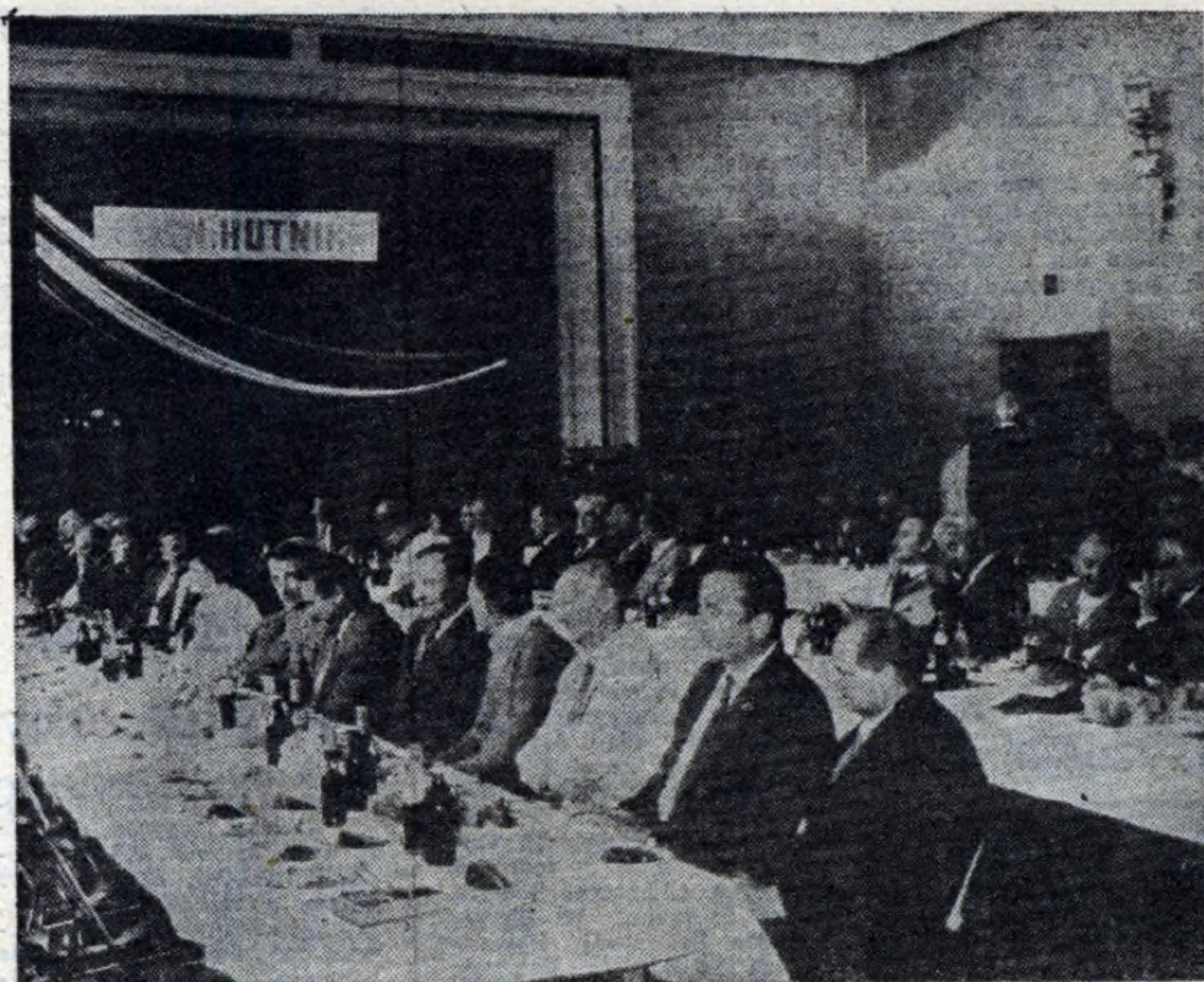
45 osób przepracowało w hucie 40 lat