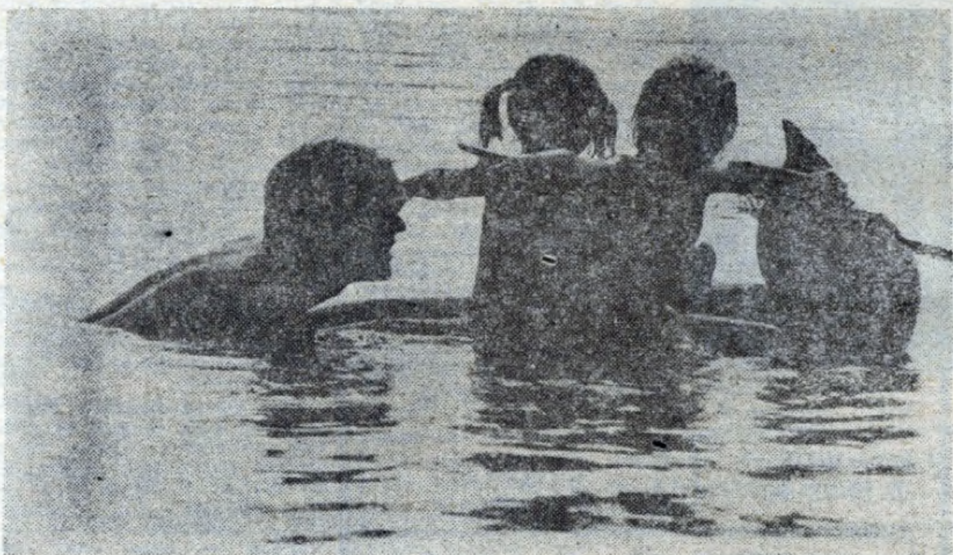
Wprawdzie na wielkie upały nie można już liczyć i kąpiele trzeba chyba odłożyć do roku przyszłego, ale za to można wypocząć taniej.

Na razie wszyscy oczekują, co w tych sprawach nowego przyniesie pakt o przedsiębiorstwie państwowym. Poprzedniemu parlamentowi nie udało się go ustanowić. (vk)