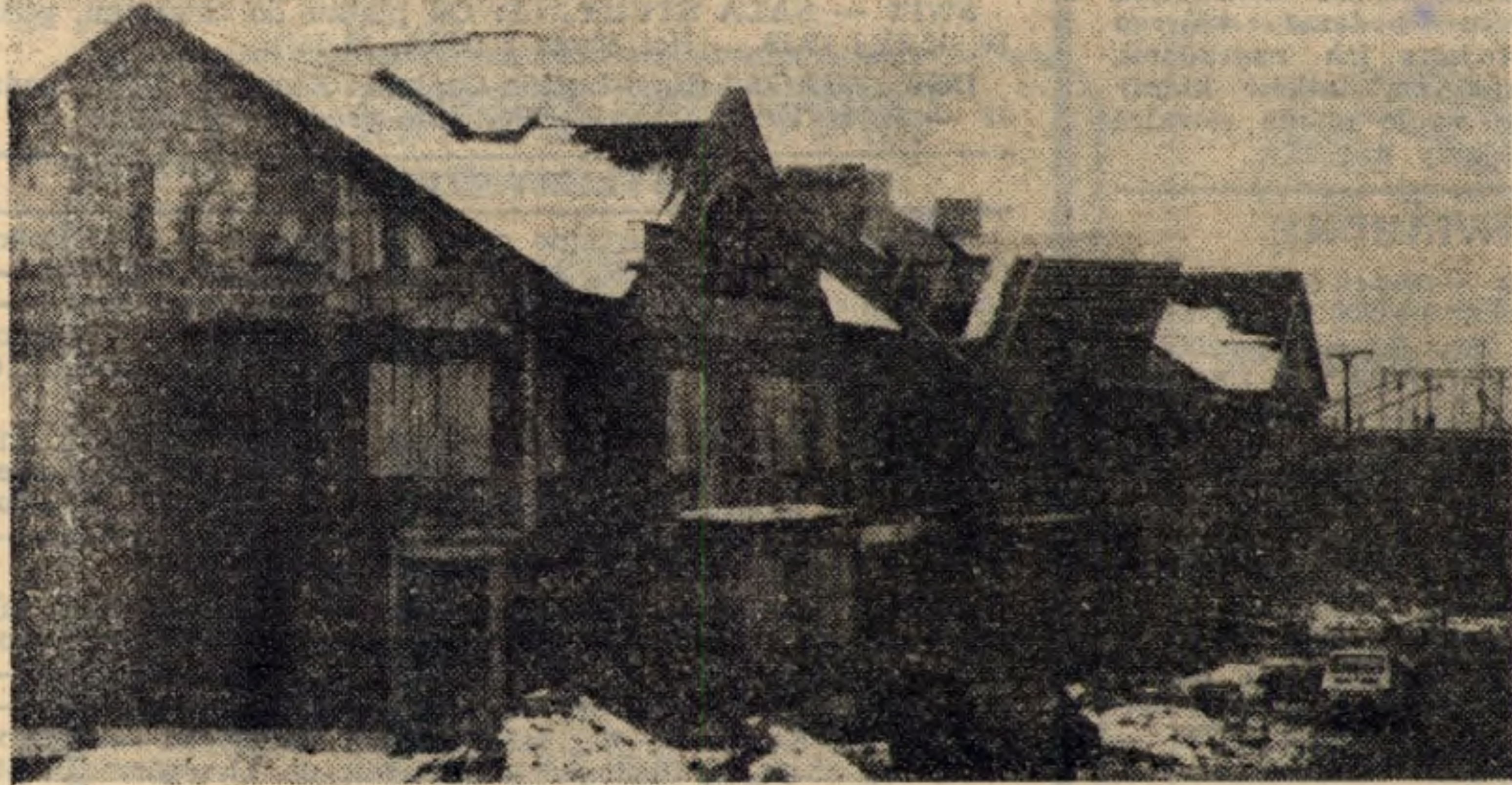
Rosną domy przy ul. Srebrnych Orłów

Po zakończeniu zbrojenia terenu i wybudowaniu domów w stanie surowym dokonuje się notarialnego przekazania nieruchomości jej właścicielom. Pozwala to na skorzystanie ze zwaloryzowanych wkładów z