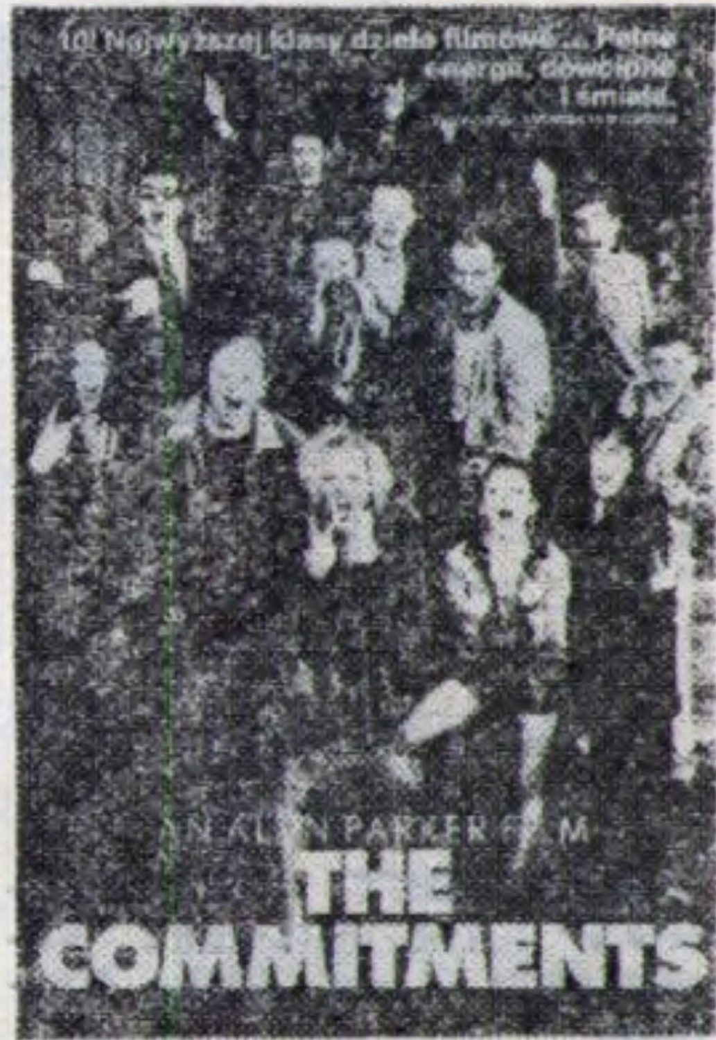
„THE COMMITMENTS” reż. Alan Parker.

„Kolorowe 10” proponuje do końca roku bezpłatne karty członkowskie.