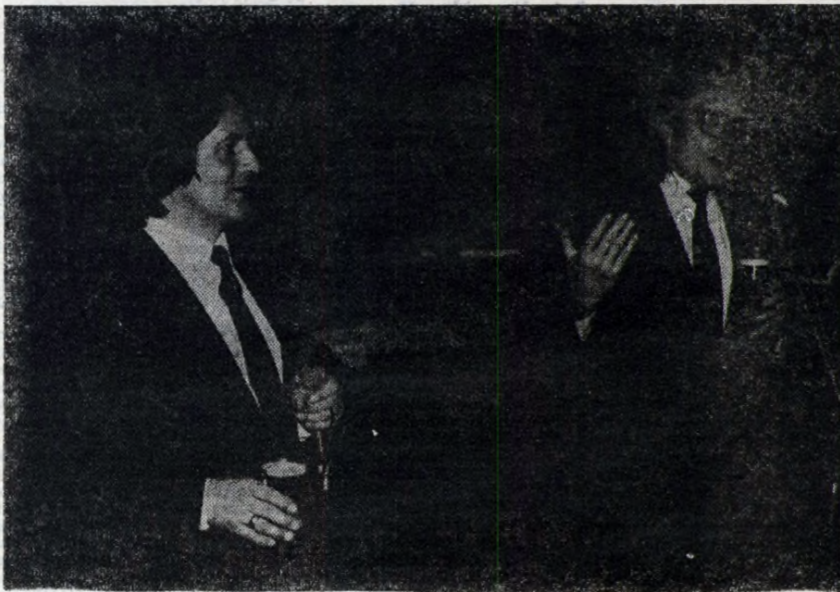
Klub Masztalskich oczarował hutniczą publiczność