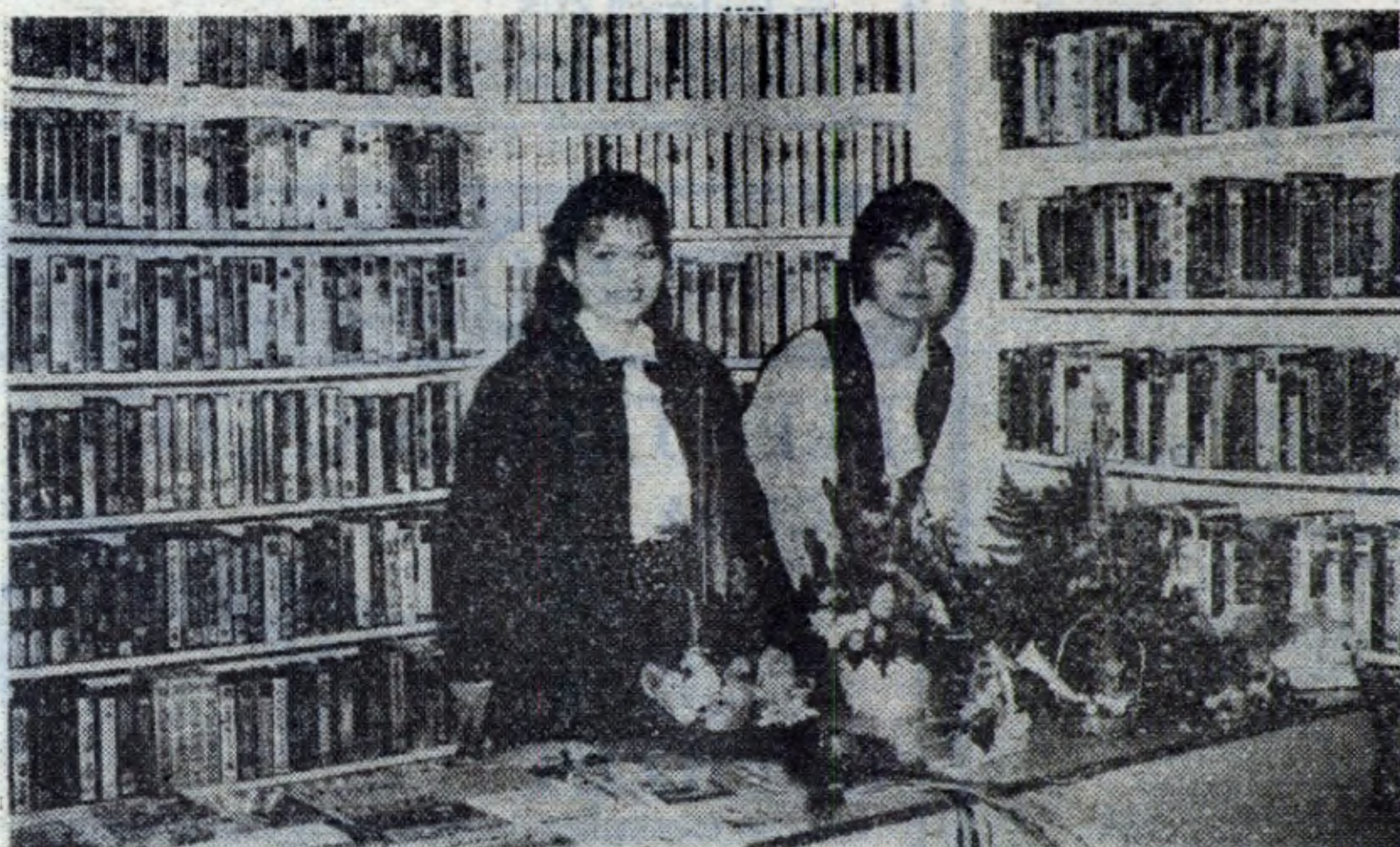
W odnowionej „Galerii Pik” panie czekają na hutników.

Przed świętami można tutaj zaopatrzyć się w śliczne stroiki wielkanocne (sprzedaje kiermaszowa), a jeszcze w najbliższych dniach będzie można kupić bilety na amerykańską rewiew na lodzie. „Galeria Pik” czynna jest od poniedziałku do piątku, w godz. 12-16. Można też dzwonić — tel. 64-46. jack