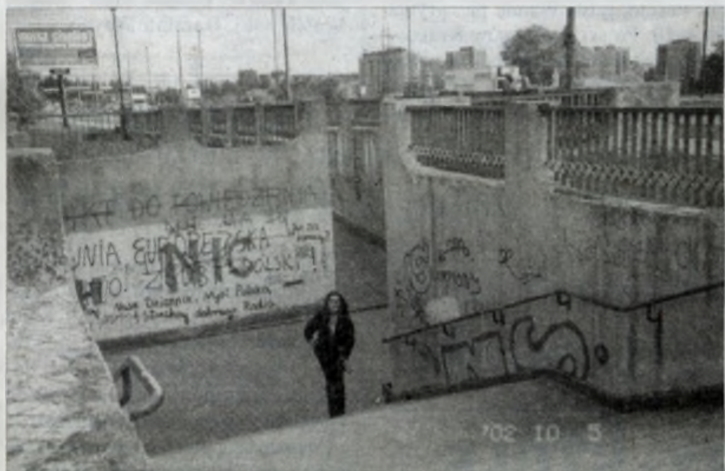
Przejścia pod jezdnią ulicy Grotta-Roweckiego nikt nawet nie próbuje odmalowywać...

– Najlepiej założyć monitoring, wynająć ochroniarzy, którzy czuwaliby nad obiektem cały dzień. Ale to kosztuje, a wiadomo, że oświata pieniędzy nie ma... (krys)