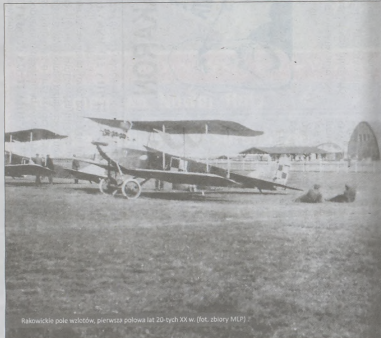
Rakowickie pole wzlotów, pierwsza polowa lat 20-tych XX w.

gicznym w skutkach trzęsieniu ziemi w Bukareszcie i olbrzymich zniszczeniach w całym kraju. Polska udzieliła natychmiastowej pomocy wykorzystując samoloty transportowe z Polskich Sił Powietrznych. Do samolotów AN-12B, dołączyły samoloty AN-26 prze-