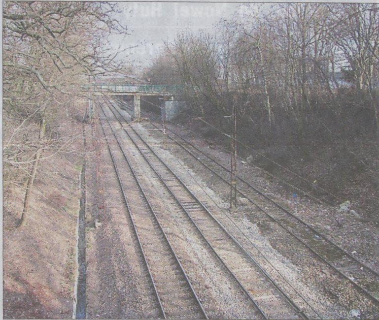
Odremontowane torowiska w okolicy Wzgórz Krzesławickich.

W pozostałe dni tygodnia można się z nią kontaktować za pomocą poczty gmh@o2.pl.