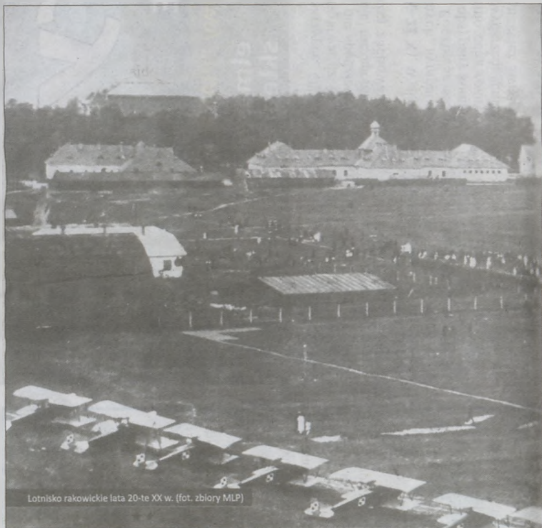
Lotnisko rakowickie lata 20-te XX w.

ka, bazę lotniczą przejmują polskie władze wojskowe i Rakowice-Czyżyny stają się lotniskiem niepodległej Polski (istnieje spór między Poznaniem i Krakowem, gdzie były początki lotnictwa? Kraków czy Poznań? Jest prawdą, że na lotnisku w Ławicy Polacy przejęli