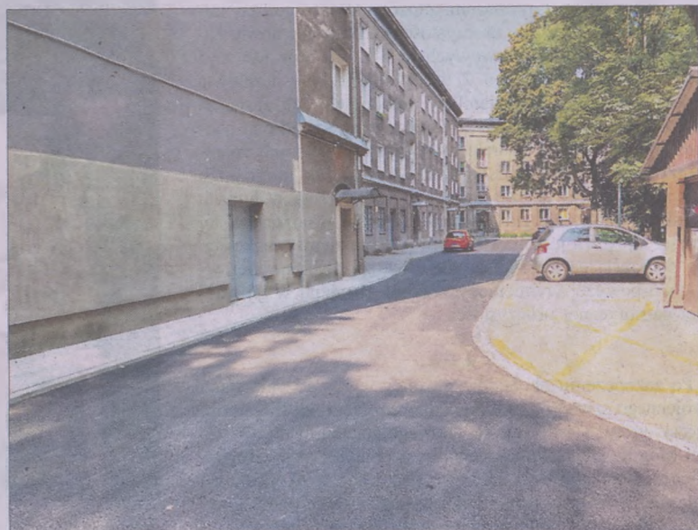
Nowa Huta Dziś 2019 – remont wykonany na os. Szkolnym.

wielu lat na kompleksowy remont czekają również al. Przyjaźni oraz al. Solidarności, o których remont rok do roku zabiegają radni dzielnicy. Bez środków miejskich wykonanie remontów wskazanych ulic będzie niemożliwe, gdyż ich koszt przekracza kilkunastokrotnie budżet dzielnicy.