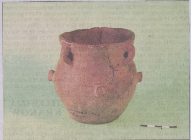
Naczynie gliniane z Pleszowa.

Glina to niezwykle w swej prostocie surowiec. O jego cudownych właściwościach świadczą chociażby kosmogoniczne przekazy mówiące o stworzeniu człowieka z glinianej materii. Uformowana w ten sposób istota ludzka stała się częścią natury, zamkniętą w cielesnej formie. Tym samym glina, służąca Stwórcy do ukształtowania własnymi rękoma człowieka, stała się pierwiastkiem boskim.