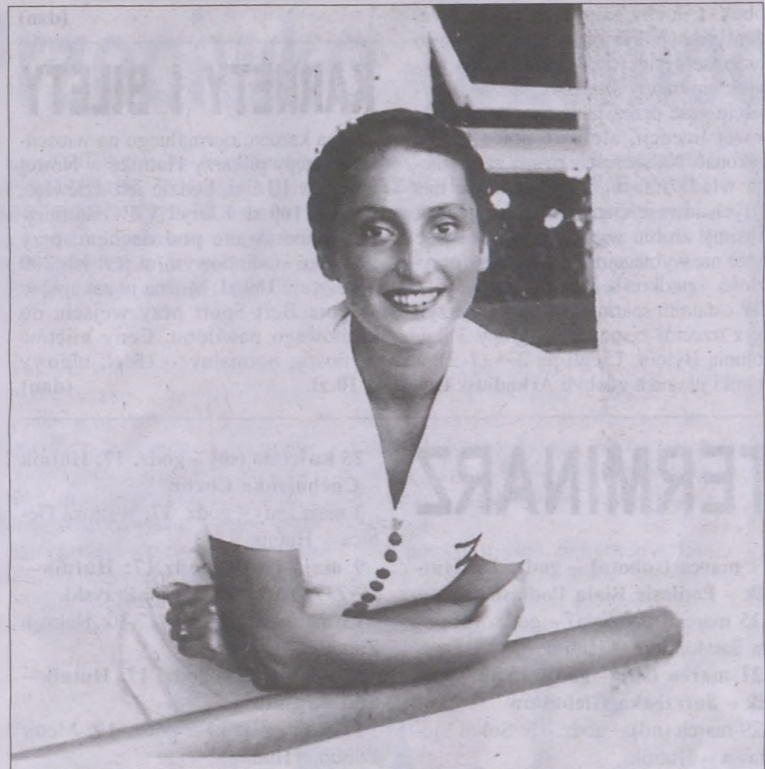
Fotografia archiwalna Zuzanny Ginczanki dzięki uprzejmości Muzeum Literatury im. Adama Mickiewicza w Warszawie.

Po rosyjsku Suzanna, po hebrajsku i w jidysz Szoszana, a po polsku – Zuzanna. Zuzanna Ginczanka, znana także jako Zuzanna Polina Gincburg, była piękna, utalentowana i pódziwiana. Mówiono: „Tuwim w spódnicy”, „Gwiazda Syjonu”, „Rachel z Wesela Wyspiańskiego”. Żydówka, Rosjanka, Cyganka czy jednak Polka? Chciała być Polką i do tej wyśnionej, wymarzonej Polski przez całe życie ją ciągnęło. Do języka, ludzi, książek i miejsc.