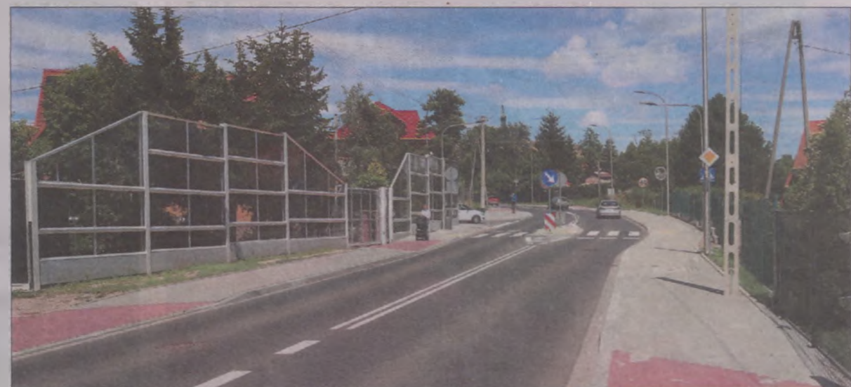
Wyremontowana ul. Klasztorna.