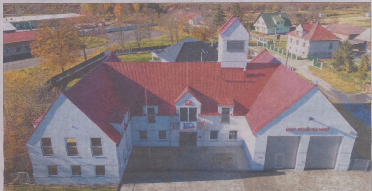
Remiza OSP w Kościelnikach.