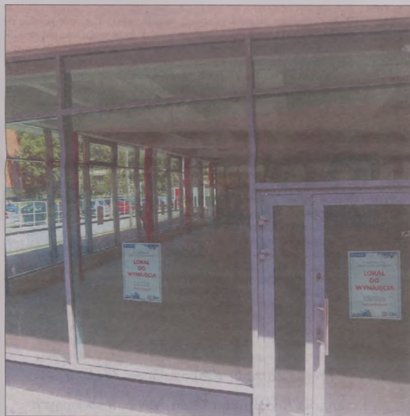
Na aukcji komunalnych lokali w czerwcu

Szczegółowych informacji w zakresie zasad przeprowadzania aukcji, jak również pustostanów lokali użytkowych skierowanych do wynajęcia udziela Referat Lokali Użytkowych Zarządu Budynków Komunalnych w Krakowie, z siedzibą ul. Czerwińskiego 16 – numer telefonu (12) 616-61-54 lub (12) 291-28-75. (mp)