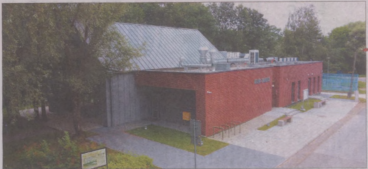
Klub „Zakole” Ośrodka Kultury Kraków-Nowa Huta w Kantorowicach.