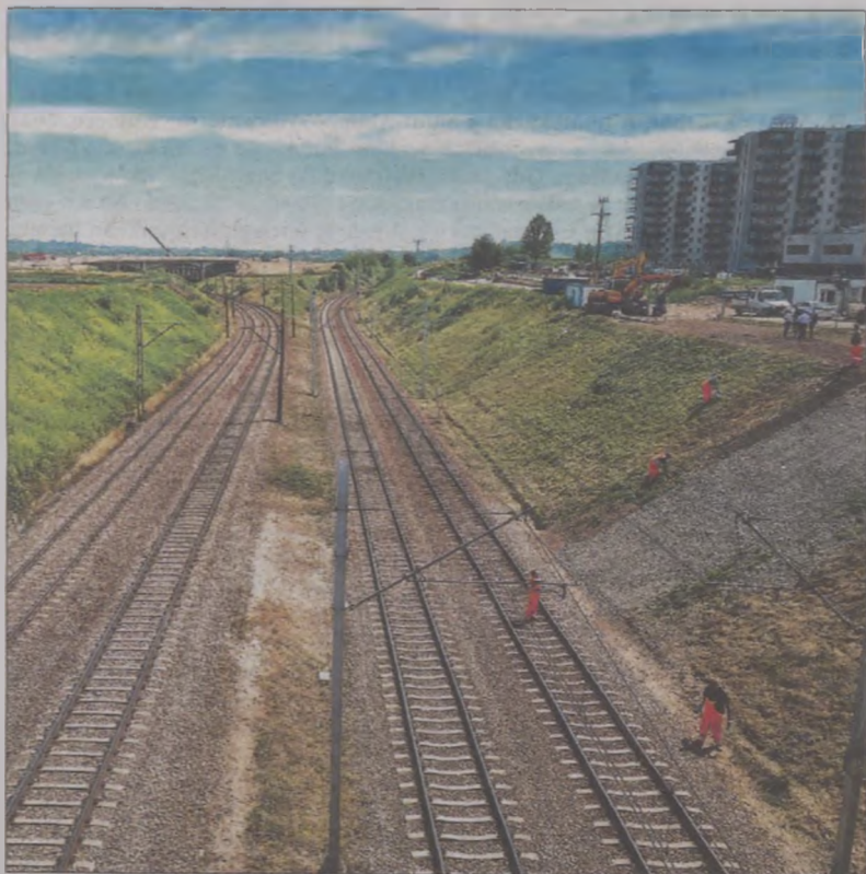
W tym miejscu powstanie nowy przystanek kolejowy Kraków Piastów.

– Kolej jest najbardziej ekologicznym środkiem transportu. Poza tym dzięki lepszemu dostępowi do kolei mieszkańcy północnej części Krakowa będą mogli łatwiej i szybciej przedostać się do centrum miasta. Kluczowy jest tu przystanek Kraków Piastów – dodał minister Adamczyk. (f)