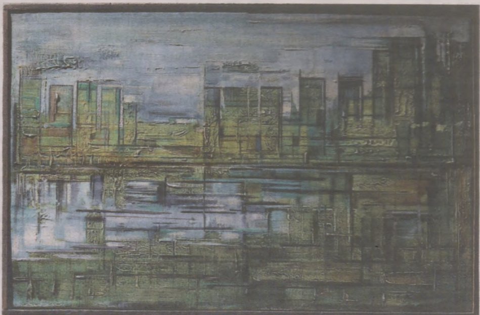
Fot. „Kombinat Nowohucki”, Ryszard Ledwos; 1964. Fot. Brajan Bednarczyk/Ośrodek Kultury Norwida

jakie tkwią w dziele. Wystawa „Wybra-ne z kolekcji” jest dostępna do zwiedza-nia do 31 sierpnia 2023 r. w godzinach pracy Galerii (środa, piątek i sobota: 11-16; czwartek: 11-19). Wstęp: 8 zł (bilet normalny), 5 zł (bilet ulgowy).