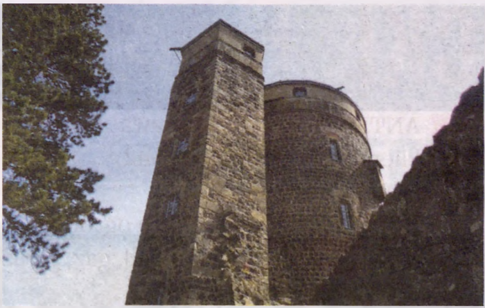
Zamek w Stolpen. Wieża, w której mieszkała hrabina Cosel.