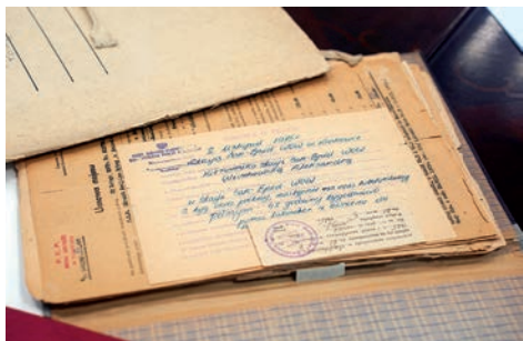
Archiwum Narodowe w Krakowie chętnie przyjmie od mieszkańców wszystkie zapiski dokumentujące życie codzienne