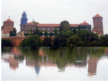
Na okładce: Wawel

Redaktor naczelna: Izabela Ronkiewicz-Brągiel Z-ca redaktor naczelnej: Paulina Knapik-Lizak