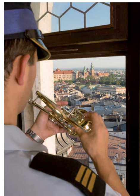
Strażak odgrywający hejnał na wieży kościoła Mariackiego