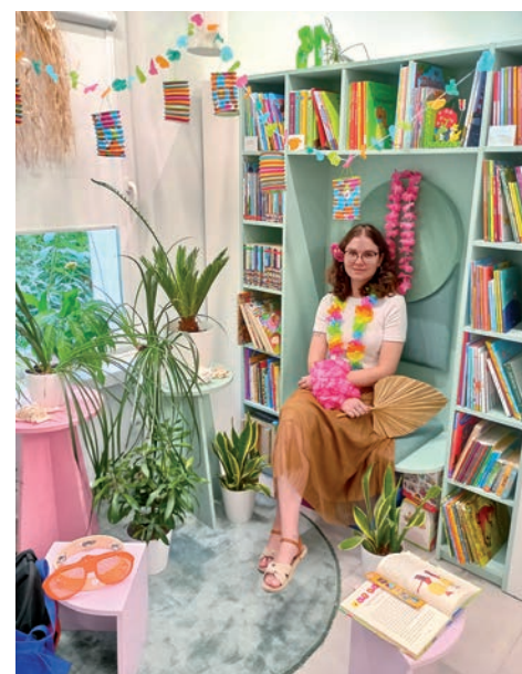
Baśń hawajska w Filii nr 8

i oferującą niezwykle wyzwania. 31 sierpnia podczas bajkowego pikniku, który odbył się w ogrodzie Biblioteki Głównej Biblioteki Kraków, najlepsze drużyny biorące udział w grze miejskiej otrzymały nagrody. Podczas pikniku można było uczestniczyć w warsztatach literackich, spotkaniach z pisarzami, czytaniu performatywnym, występach artystycznych i warsztatach teatralnych. Zwycięzcom serdecznie gratulujemy! Dziękujemy wszystkim śmiałkom, którzy wyruszyli z nami w tę niesamowitą baśniową podróż!