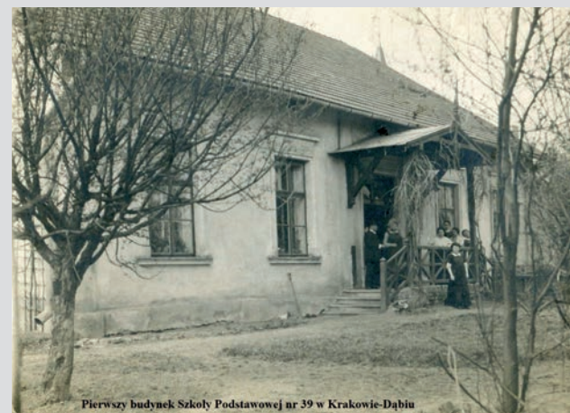
Pierwszy budynek Szkoły Podstawowej nr 39 w Krakowie-Dąbiu

Lokalizacja wystawy w Filii nr 7 Biblioteki Kraków, niemal w samym sercu Dąbia, zachęca do „uzupełnienia” jej krótkim