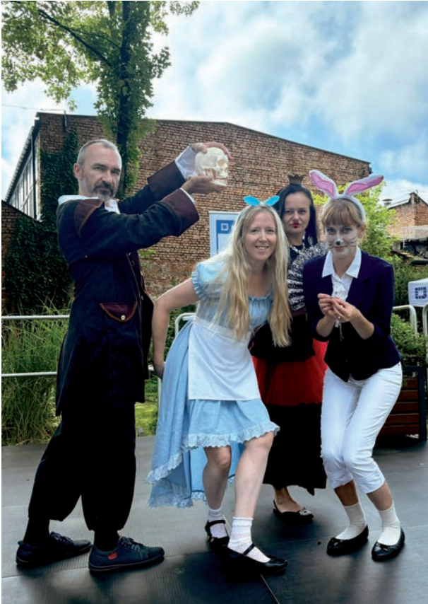
Piknik brytyjski. Bibliotekarze przebrani za: Williama Shakespeare'a, Alicję, Królową Kier, Białego Królika z Krainy Czarów