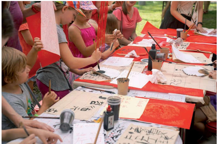
Warsztaty pisania imion w języku chińskim