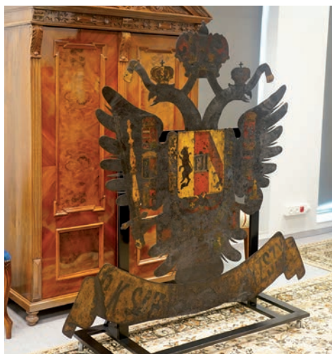
C.k. orzeł, czyli biały kruk ANK

Pamiętam, gdy grzebiąc u Was w Archiwum zupełnie za czym innym, znalazłam skargę mieszkańca na zbyt głośnego w jego ocenie psa w dowdy bodajże po prezydencie Leo. Albo cały pakiet afiszy i zaproszeń na obchodzone oficjalnie w całej Polsce w międzywojniu