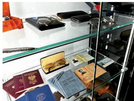
Niezwykłe pamiątki po pisarzu

film dokumentalny pt. Jak z Mrożka zrealizowany przez Martę Węgiel, który powstał we współpracy Biblioteki Kraków z TVP3 Kraków.