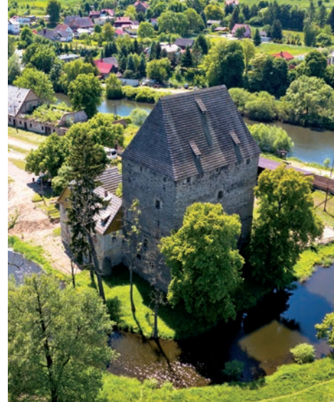
Wieża rycerska w Siedlęcinie

wykonanie ścięto w 1313 r., to zaś świadczy o dacie powstania budynku. Piwnica i parter budowli przeznaczone były na pomieszczenia gospodarcze i magazynowe, piętra od pierwszego do trzeciego miały charakter mieszkalny, a najwyższe – obronny. Drugie pełniło funkcje reprezentacyjne. Znajdowała się tu tzw. Wielka Sala – komnata gościnną, miejsce spotkań oraz uczt. Jej ściany ozdobiono polichromiami obrazującymi rycersko-romansową opowieść o najstynniejszym z rycerzy Okrągłego Stołu sir Lancelocie z Jeziora i królowej Ginewrze oraz freskami o charakterze religijno-moralizatorskim. Odkryte pod koniec XIX wieku są najcenniejszym obiektem w ramach całego założenia i, co ważne, prawdopodobnie jedynymi średniowiecznymi malowidłami naściennymi obrazującymi tę historię. Wyobraźnia zaczyna pracować... powoli wczuwamy się w klimat tamtych wieków, widzimy strojne damy i walecznych rycerzy konwersujących podczas wystawnych uczt,