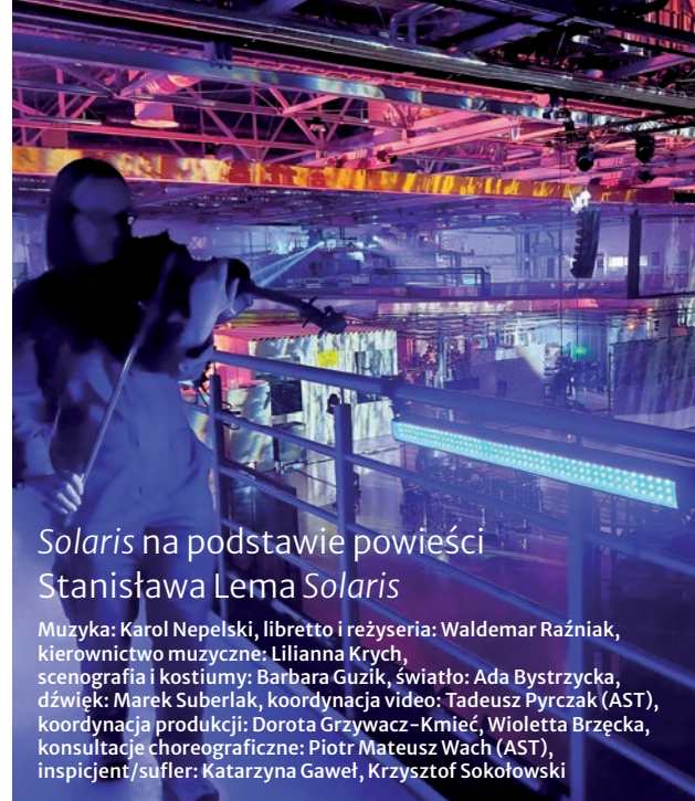
Solaris na podstawie powieści Stanisława Lema Solaris

Spektakl powstał jako koprodukcja Festiwalu Opera Rara, Narodowego Starego Teatru im. H. Modrzejewskiej w Krakowie, Hashtag Ensemble i Warszawskiego Towarzystwa Scenicznego.