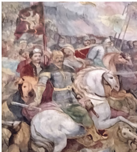
Przedstawienie Mikołaja Branickiego z kościoła pw. Św. Piotra i Pawła w Krakowie