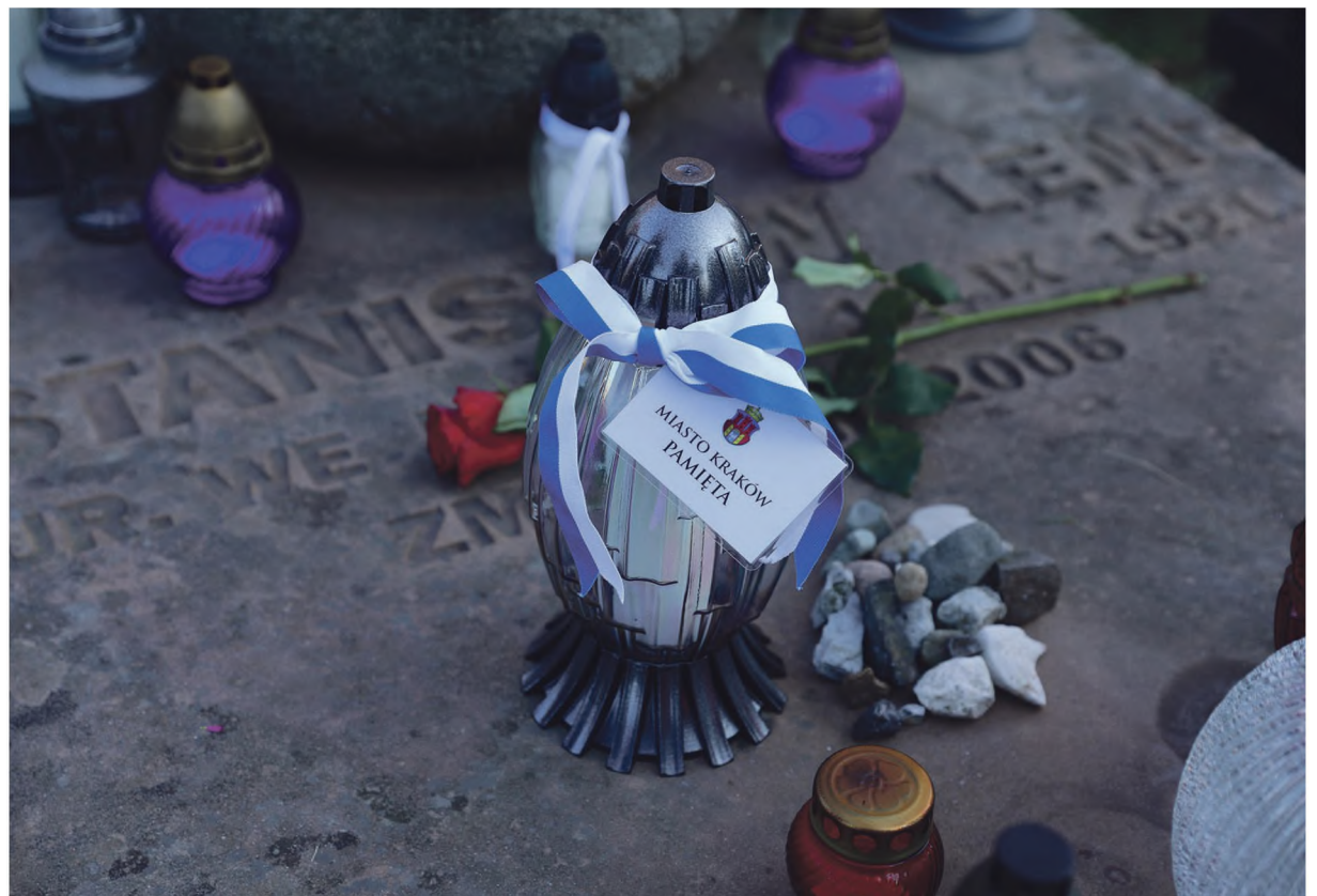
Znicze z napisem „Miasto Kraków pamięta” zapłoną na wielu grobach osób zasłużonych dla Krakowa.