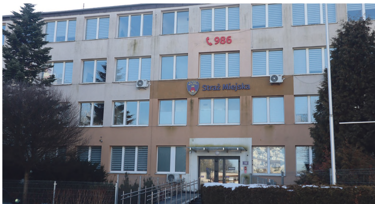
W siedzibie Straży Miejskiej będzie przeprowadzona modernizacja