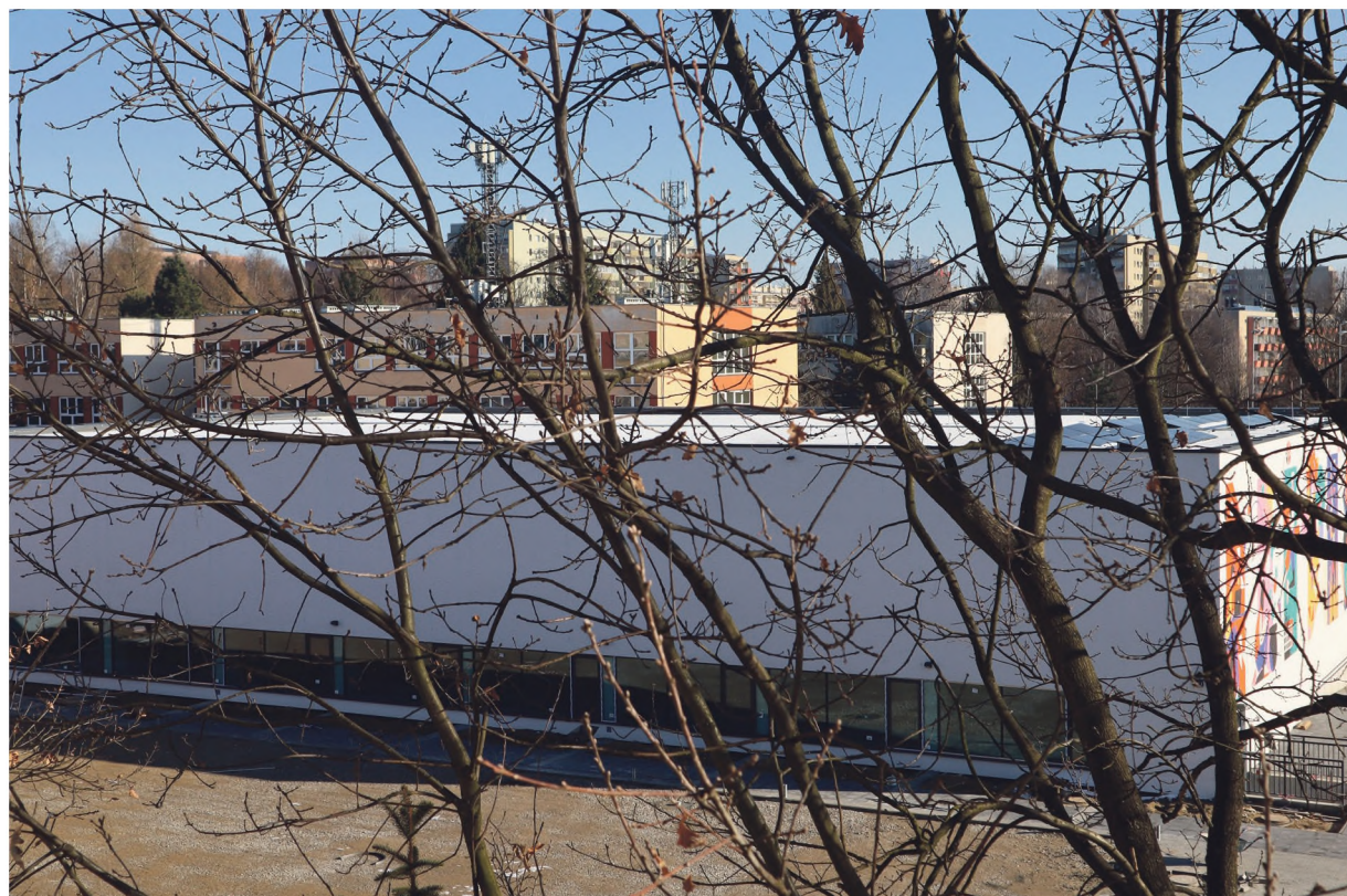
Hala sportowa przy XXX LO będzie oddana w tym roku

W tym zakresie zgodnie z wcześniejszymi staraniami radnych jeszcze z poprzedniej kadencji przewidziano kilka dużych inwestycji. Najwięcej pieniędzy trafi do XXX LO w os. Dywizjonu 303, bo 8,450 mln zł na dokończenie budowy hali widowiskowo-sportowej, która będzie oddana do użytku w tym roku. Podobnie w tym roku mieszkańcy otrzymają do użytku Młodzieżowy Ośrodek