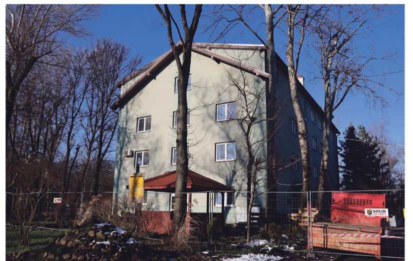
DPS przy ul. Sołtysowskiej będzie wyremontowany