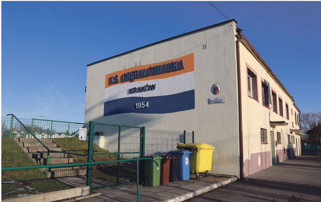
Stadion Góralowianki zostanie zmodernizowany

Zgodnie z zapowiedziami z poprzedniego numeru „Głosu” wracamy do ważnego dokumentu, jakim jest budżet Miasta Krakowa na rok 2025, który określa rozwój miasta i kierunki jego rozwoju. Tym razem przybliżamy szczegóły związane z dochodami i wydatkami, które są osi każdego budżetu. Pokazujemy skąd się biorą głównie dochody i gdzie są skierowane głównie wydatki. Zgodnie z charakterem naszej lokalnej gazety tradycyjnie przybliżamy szczegółowo najważniejsze inwestycje w dzielnicach nowohuckich.