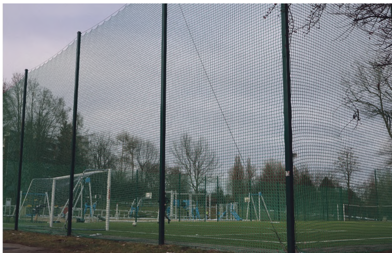
Boisko przy Szkole Podstawowej nr 77 w os. Złotego Wieku otrzyma oświetlenie.

W tej dzielnicy w budżecie umieszczono siedem zadań, ale kwoty nakładów są tutaj zdecydowanie mniejsze. 150 tys. zł zostanie wykorzystane na oświetlenie boiska przy Szkole Podstawowej nr 77 na os. Złotego Wieku 36. Natomiast 50 tys. zł przeznaczono na budowę i przebudowę ciągów pieszych na terenach zielonych tej Dzielnicy. Za 15 tys. zł zostanie wyposażona Dzielnica XV w elementy małej architektury. 60 tys. zł będzie wykorzystane na budowę siłowni zewnętrznej na os. Oświecenia w trybie „zaplanuj i wybuduj”. 50 tys. zł jest przeznaczony na budowę schodów i przebudowę ciągów