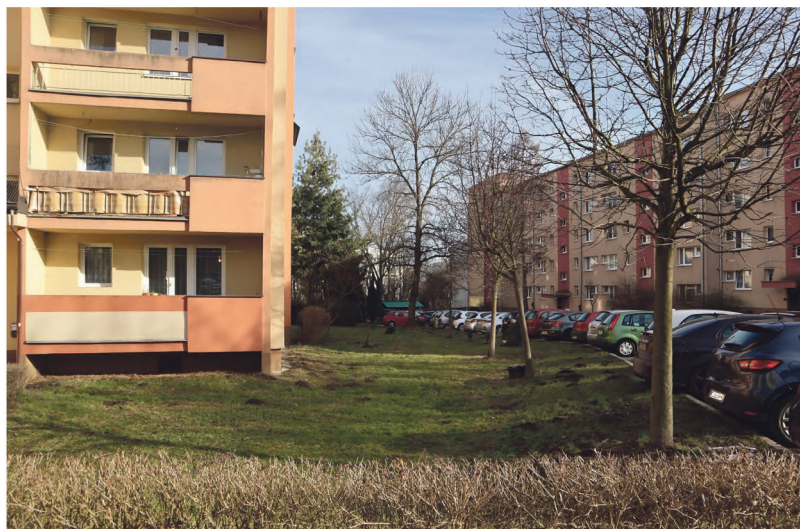
Zielony skwer pomiędzy blokami 8-9 w os. Boh Września zostanie zagospodarowany.

Omawiamy te zadania według kolejności umieszczonej w Budżecie Krakowa. W tej dzielnicy przewidziano sześć zadań, ale przeznaczono na nie spore