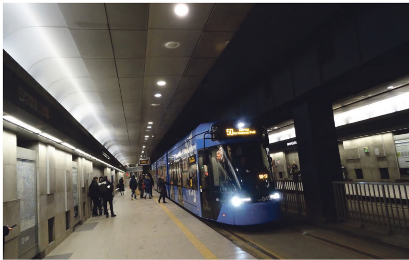
W Krakowie już powstał tunel dla tramwajów pod dworcem PKP

Zamysł budowy metra w Krakowie powstał kilkadziesiąt lat temu ale mówiono o tym mało i rzadko. Dla jednych była to fantasmagoria, inni dostrzegali biedę państwa i miasta, jako przeszkodę. Ale gdy zaczęliśmy powszechnie kupować samochody i utykać w korkach komunikacyjnych ten i ów zaczął przebąkiwać o metrze. Po wyborach czerwcowych 1989 roku i po przystąpieniu Polski do Unii Europejskiej zaczęliśmy jeździć po świecie dzięki trzymanemu w domu paszportowi, a po Europie nawet na dowód osobisty. W wielu odwiedzanych miastach, nawet mniejszych od Krakowa, jeździliśmy metrem. Zazdrościliśmy wygody i marzyliśmy o tym samym.