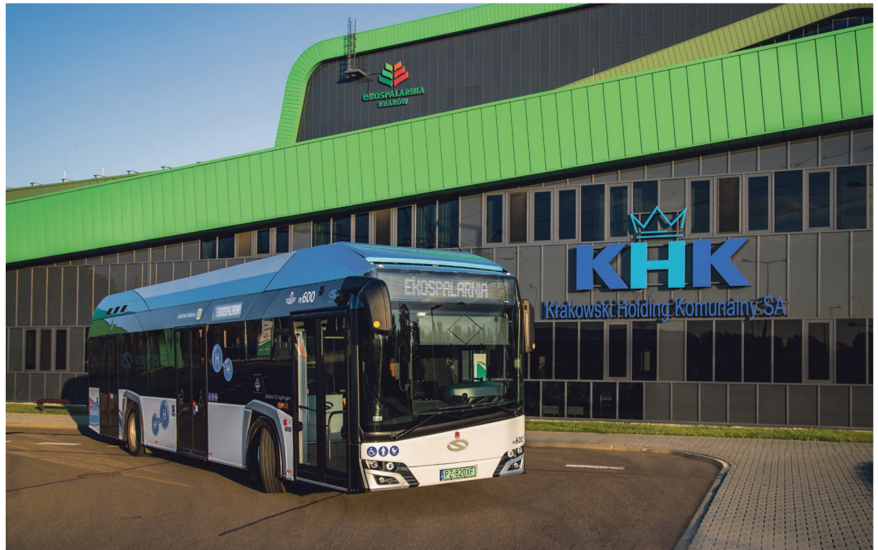
Autobus wodorowy pod Ekospalarnią

2024 rok był rokiem świętowania 20-lecia członkostwa Polski w Unii Europejskiej. Przez cały marzec spółki miejskie, instytucje kultury, muzea, a także jednostki Urzędu Miasta Krakowa otwierając się na mieszkańców pokazywały namacalny wpływ funduszy europejskich na rozwój ich działalności. W Krakowie dwie dekady wsparcia finansowego