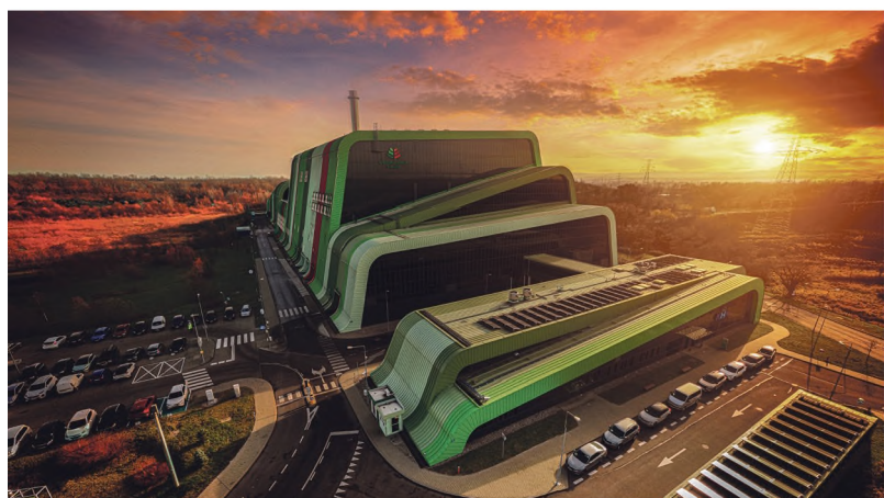
Jesienne widoki