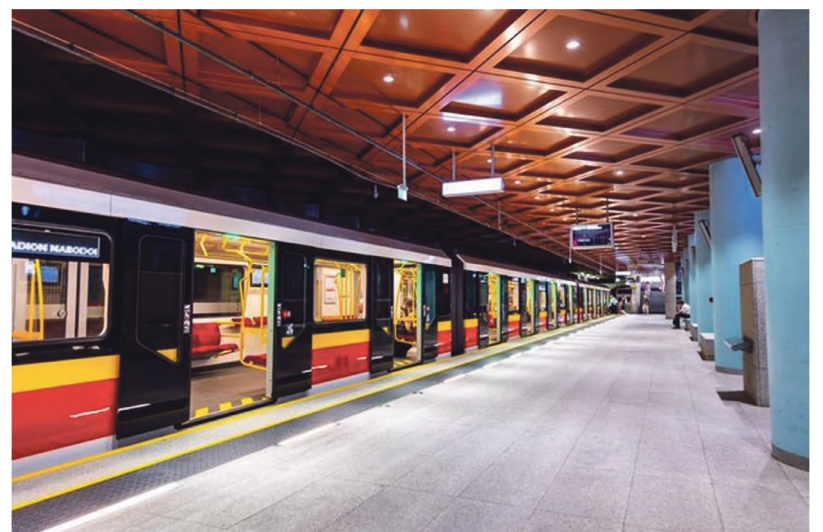
Społeczny Komitet Budowy Metra odegrał istotną rolę w powstaniu metra w Warszawie.

Bieżące informowanie o postępach przygotowań do budowy metra objawiać się powinno nie tylko w trakcie Informacji Prezydenta składanych Radzie Miasta, prowadzeniu zakładki METRO na stronie Magicznego Krakowa, czy wywiadach prasowych. Istnieje wiele możliwości kontaktu z mieszkańcami w każdym wieku metrykalnym. Podczas wspomnianego posiedzenia Rady Naukowej wskazano na kilka z nich. Oto Akademia Górniczo-Hutnicza ma kopalnię doświadczalną, w której można by przedstawić i zaznajomić zainteresowanych