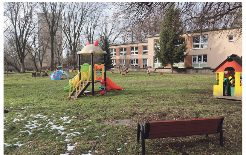
Zostanie zmodernizowany plac zabaw przy Samorządowym Przedszkolu nr 116 w os. Jagiellońskim 16.