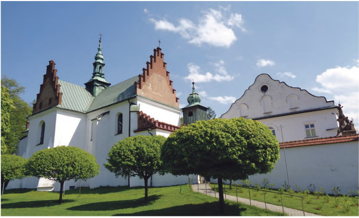
Klasztor w Szczyrzycu