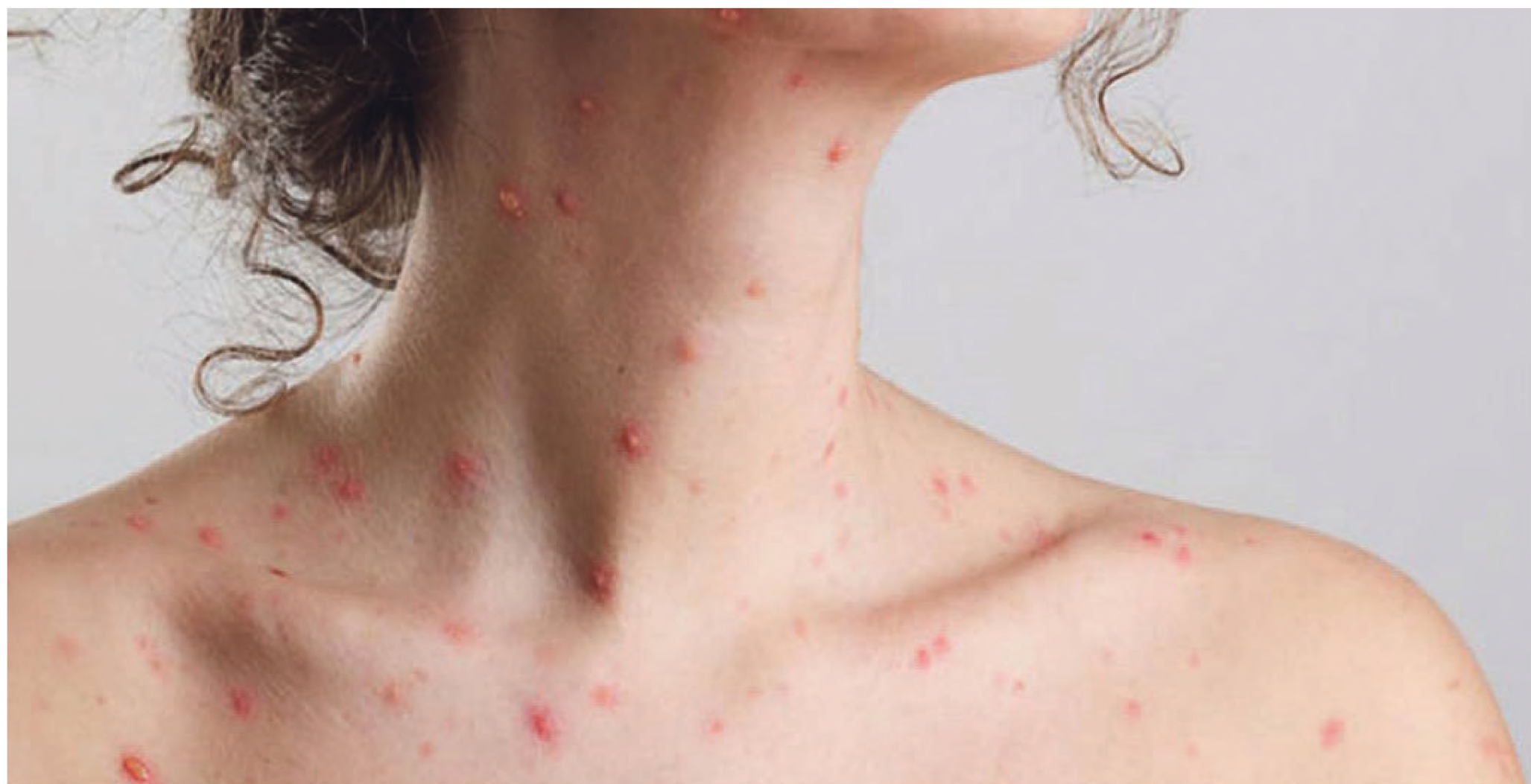
Tak może wyglądać półpasiec