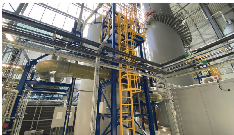
Instalacja odzysku ciepła ze spalin (UOC), fot. Archiwum KHK SA