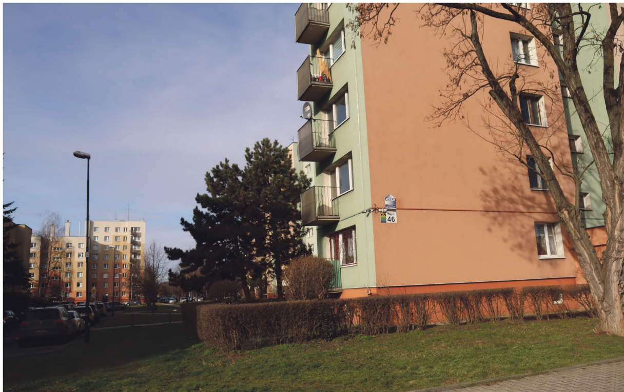
Przy bloku 46 w os. 2 Płk. Lotniczego zostaną zmodernizowane miejsca postojowe

W ostatnich dwóch numerach Głosu przybliżyliśmy najważniejszy dokument jaki określa rozwój miasta, budżet Krakowa na rok 2025, przyjęty przez Radę Miasta Krakowa w grudniu ub. roku. Najpierw omówiliśmy główne kierunki i zasady przyjęte w budżecie.